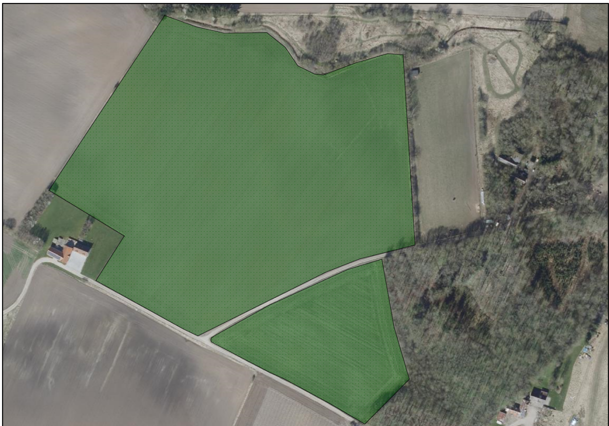
Skovkort over ansøgt skovrejsning på matr.nr. 10f Nebsager By, Nebsager. Skovrejsningsarealet er angivet med grøn fladesignatur. Kort fra ansøgningsmateriale.

Ansøgningen er indsendt af Skovdyrkerne Syd på vegne af lodsejere og omfatter to skovrejsningsarealer på 7,2 ha og 1,6 ha (samlet 8,8 ha). Se nedenstående kort.