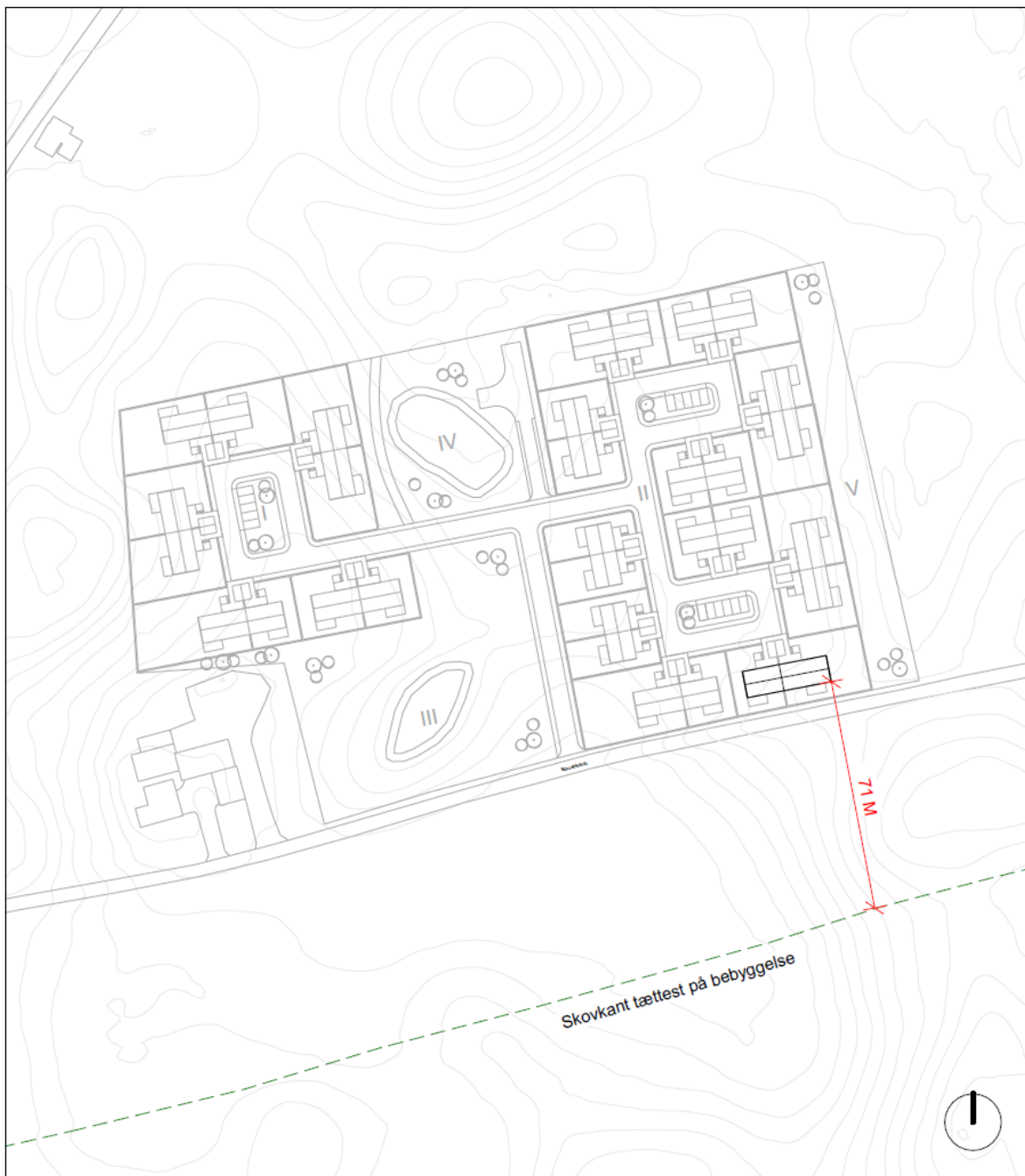
Ansøgers indsendte situationsplan med angivelse af den korteste afstand mellem boliger og skovbryn, som er på 71 meter