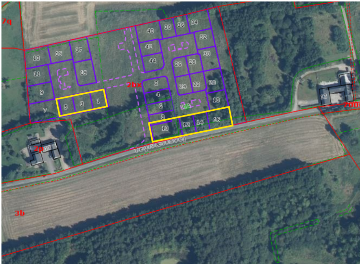
Den omtrentlige placering af det ansøgte vist med gule rektangler på luftfoto fra 2025