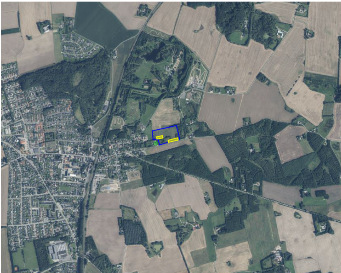
Lokalplansafgrænsningens placering i landskabet vist med blå strek og placeringen af de konkrete boliger, som kræver dispensation fra skovbyggelinjen, vist med gul strek på luftfoto fra 2025

Afgørelsen vil så vidt muligt blive offentliggjort mandag den 6. juli 2026 ved annoncering på Hedensted Kommunes hjemmeside .