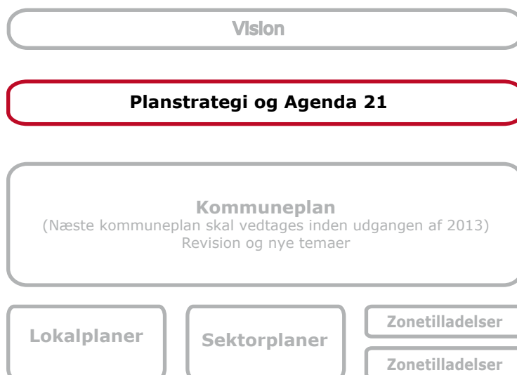
Figuren viser de forskellige planniveaues sammenhæng

Lokalplan 1060 Etageboliger ved Gl. Landevej 26