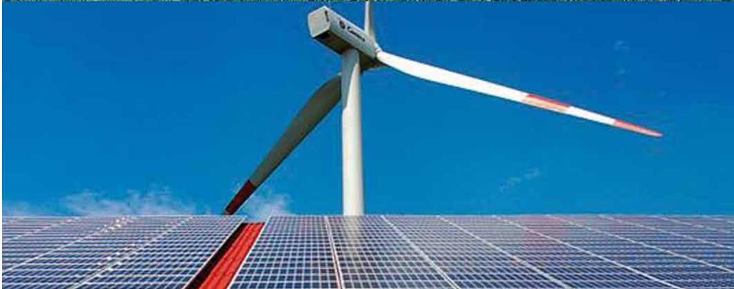
Ovenstående billeder © NIRAS