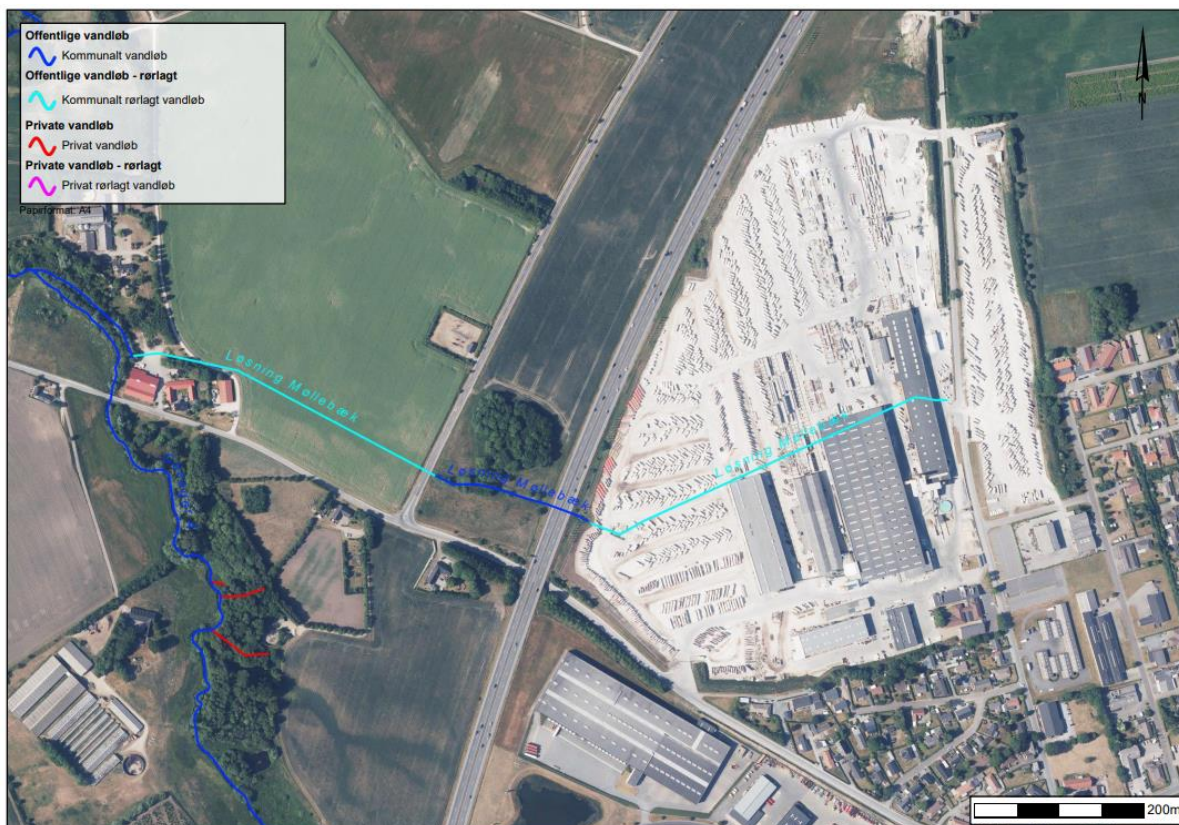
Figur 1. Den rørlagte strækning af Løsning Møllebæk under A/S Boligbetons arealer er markeret med lyseblå. Ved motorvejen bliver vandløbet åbent på en kort strækning inden det igen bliver rørlagt mod udløbet i Gesager Å.