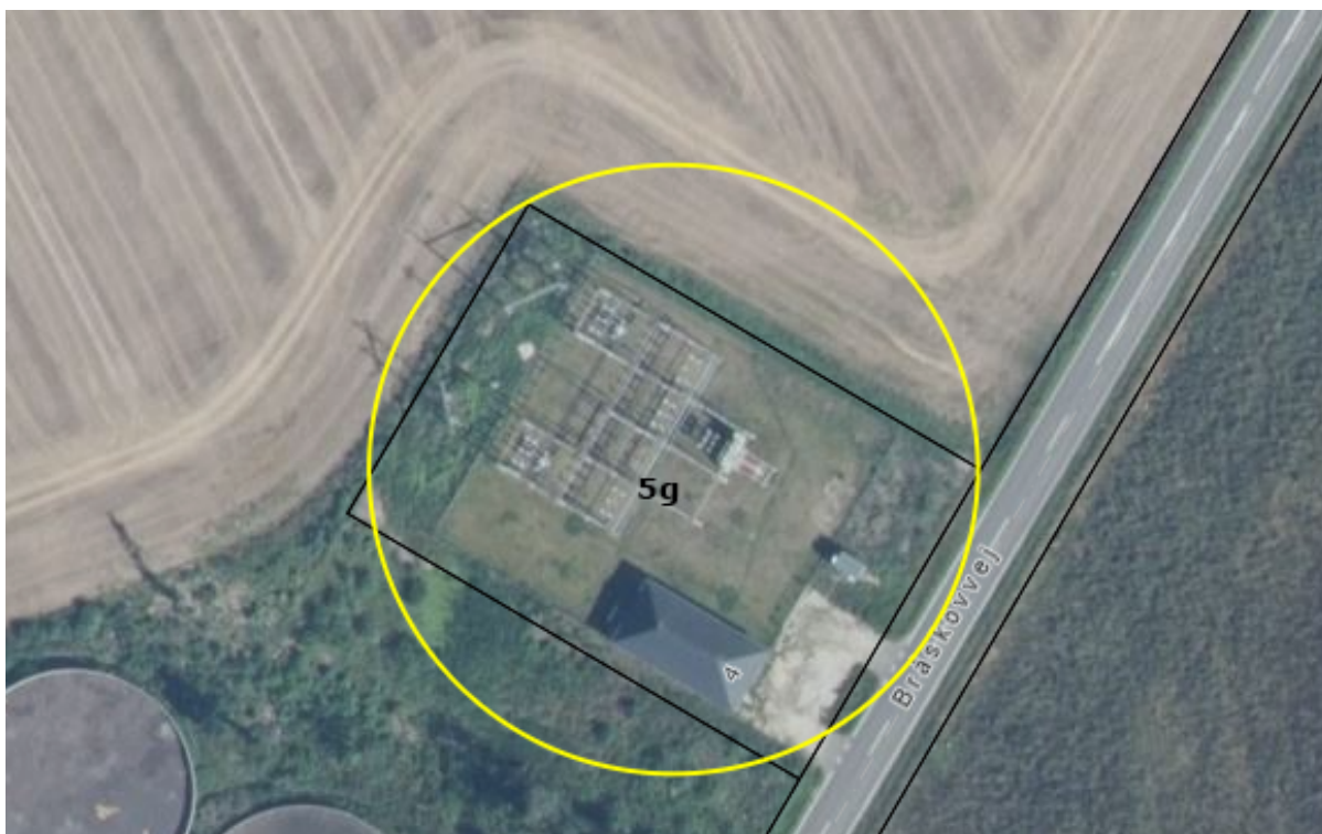
Den omtrentlige placering af det ansøgte vist på luftfoto fra 2024