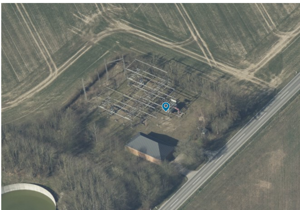
Den omtrentlige placering af det ansøgte vist på skråfoto fra 2023