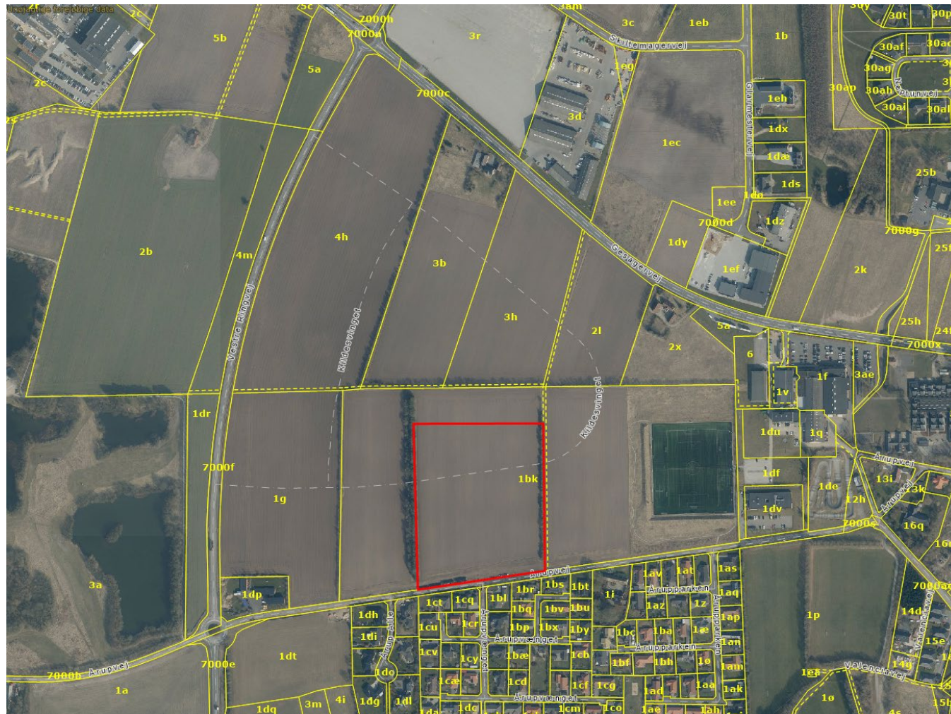
Oversigtskort med afgrænsning af planområdet markeret med rød streg