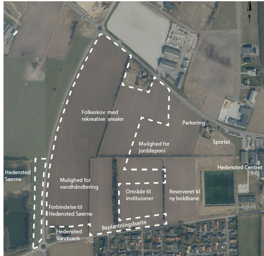
Luftfoto med den kommende folkeskov markeret med hvid stiplede streg og beskrivelse af andre funktioner i området

Mod vest ligger Vestre Ringvej og Hedensted Vandværk. På modsatte side af Ringvejen ligger et større rekreativt naturområde med Hedensted Søerne og erhvervsområdet Kildeparken. Mod syd ligger Årupvej og boligområderne Årupvænget og Årupparken.