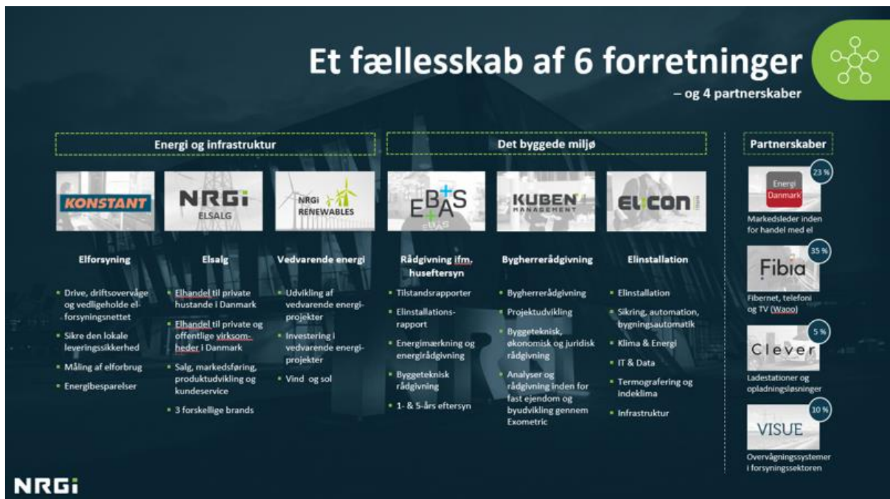
Figur 5: NRGi består af 6 forretninger og en række partnerskaber.

NRGi-koncernen er et forbrugerejet fællesskab af virksomheder, som arbejder inden for energi, grøn omstilling og det byggede miljø, og som det fremgår af nedenstående spænder vi bredt indenfor energi- og klimaområdet.