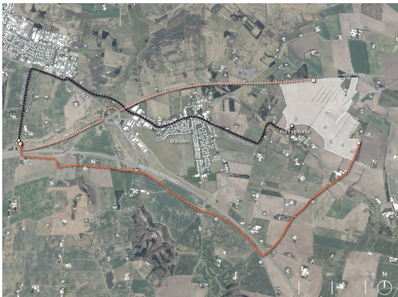
Figur 3. Placering af solcellepark samt kabelanlæggets tre mulige ruter. Det nedgravede kabelanlæg vil have en længde på 5-7 kilometer, afhængig af hvilken rute der vælges.

Det nye kabelanlæg udføres som et nedgravet kabel. Det endelige forløb er endnu ikke færdigprojekteret, men der er udvalgt tre mulige ruter som alle følger eksisterende vejanlæg (se figur 3).