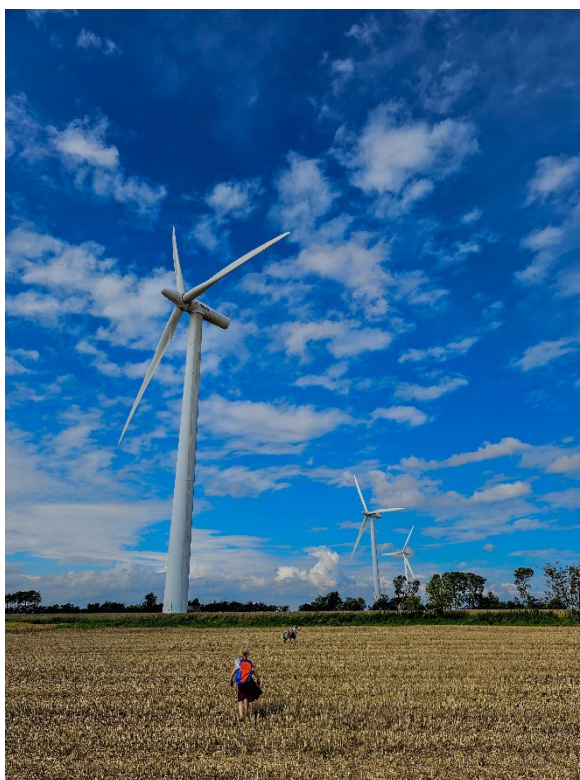
Billede af møllerne på tæt hold, august 2023.

Arbejdsgruppen har en ambition om, at Blæsbjerg Energipark kan blive et fyrtårnsprojekt for andre energifællesskaber i Danmark og som en del af dette, bidrage til at Hedensted Kommune, kan blive Danmarks mest klimavenlige samfund.