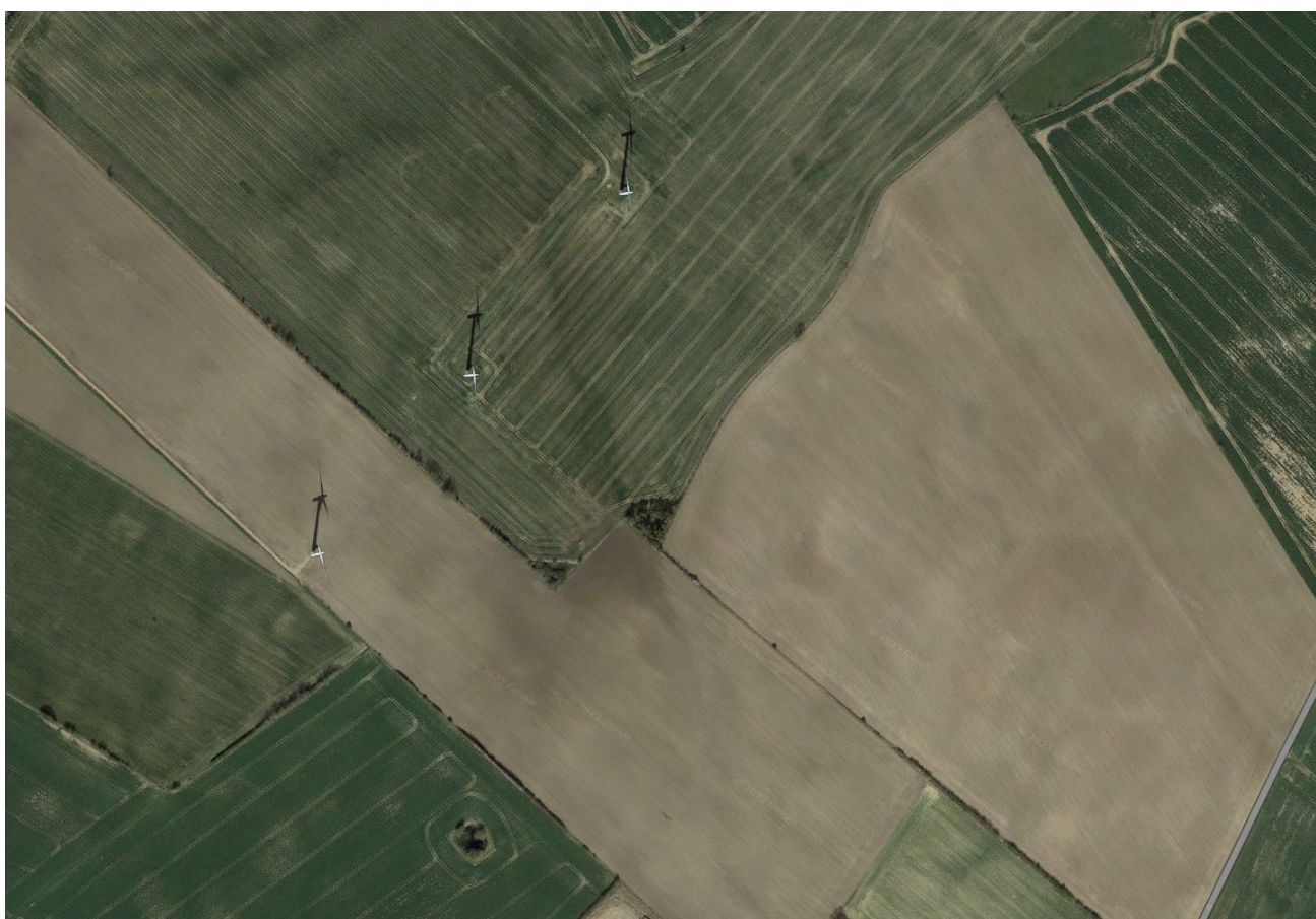
Nuværende tre møller set oppefra.

Fra 2019 overtager den ene lodsejer laugets mølle.