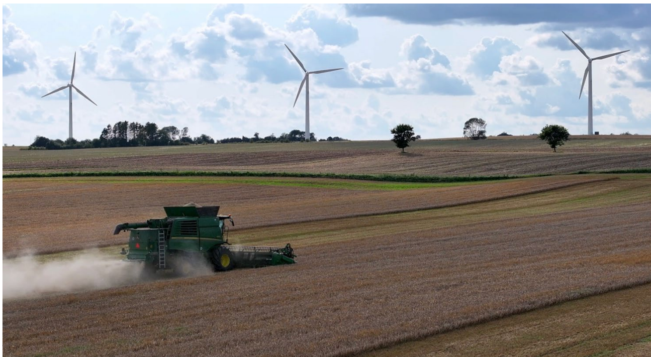
Billede af alle 3 nuværende møller under høsten 2023.

Delmål C indenfor Erhverv; Færre fossile brændsler til energi i industrien.