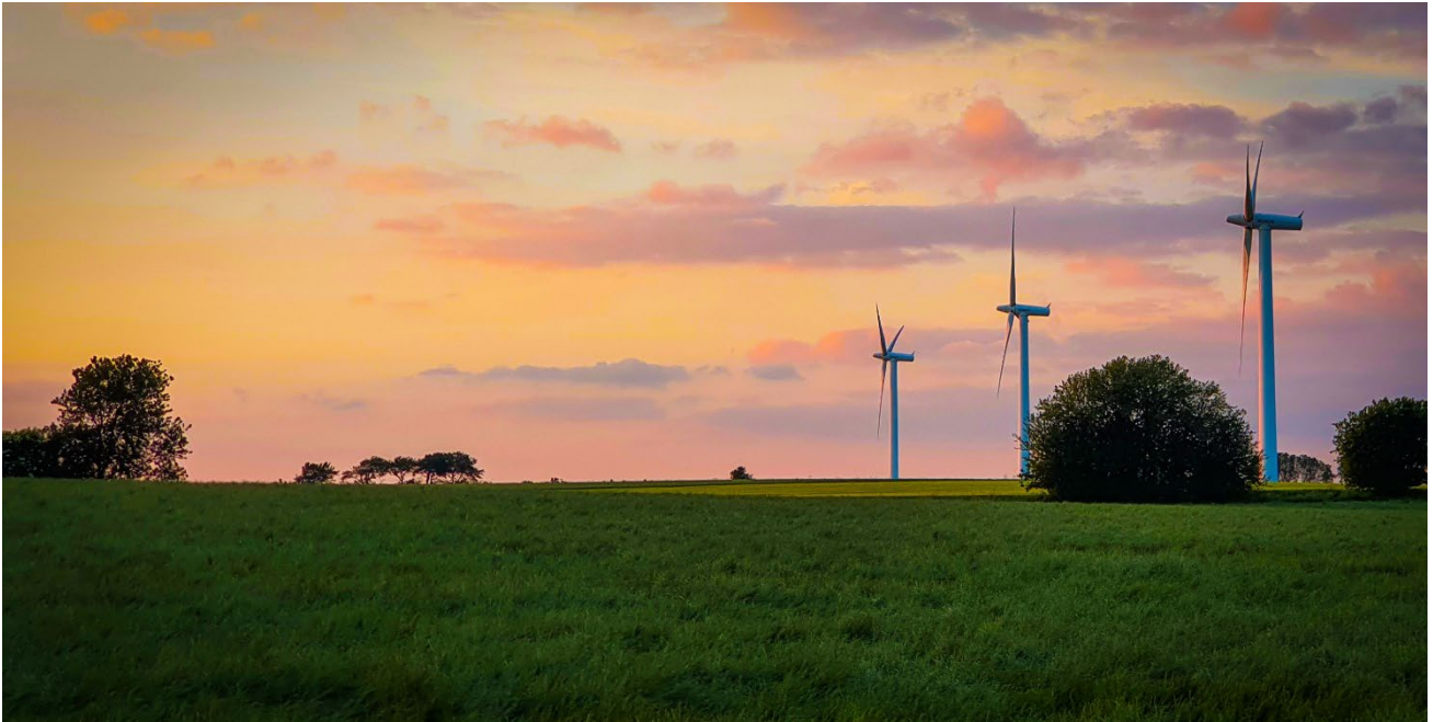
De tre nuværende møller i fuld sving ved solnedgang.

Området ved Blæsbjerg ligger i ca. 97 meters højde over havets overflade og er betegnet som ét af Østjyllands bedste placeringer af vindområder.