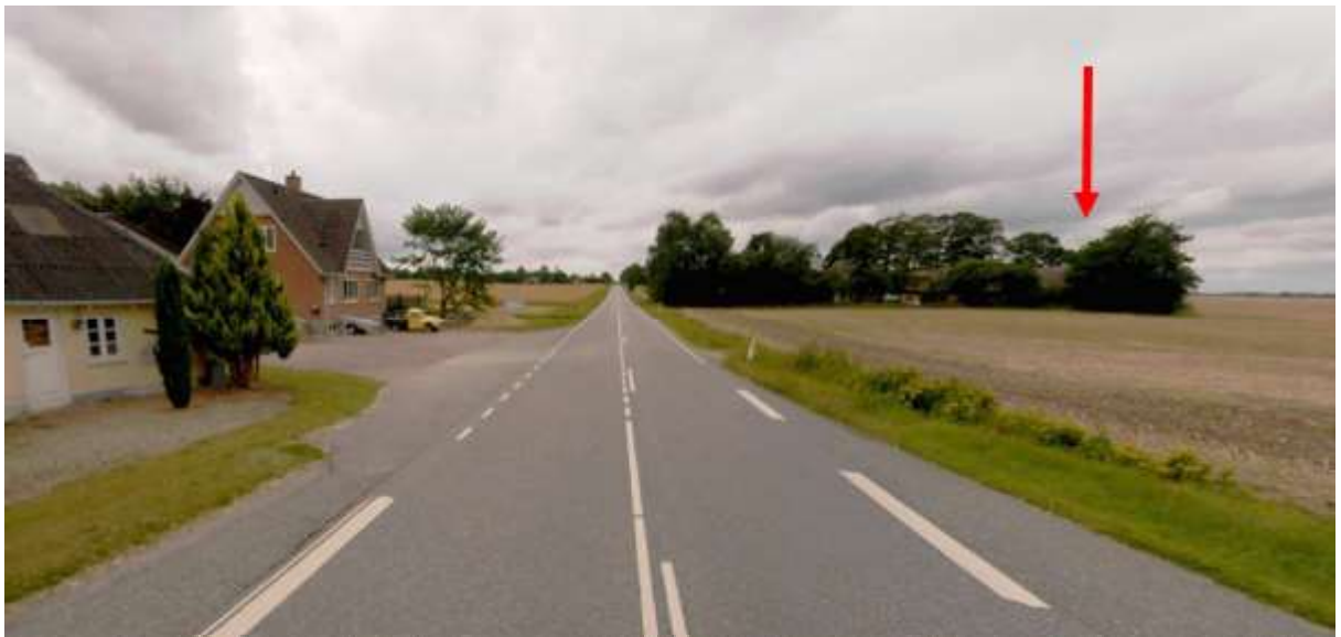
Mastens placering (rød pil) på foto fra COWI set fra Korningvej fra øst mod vest