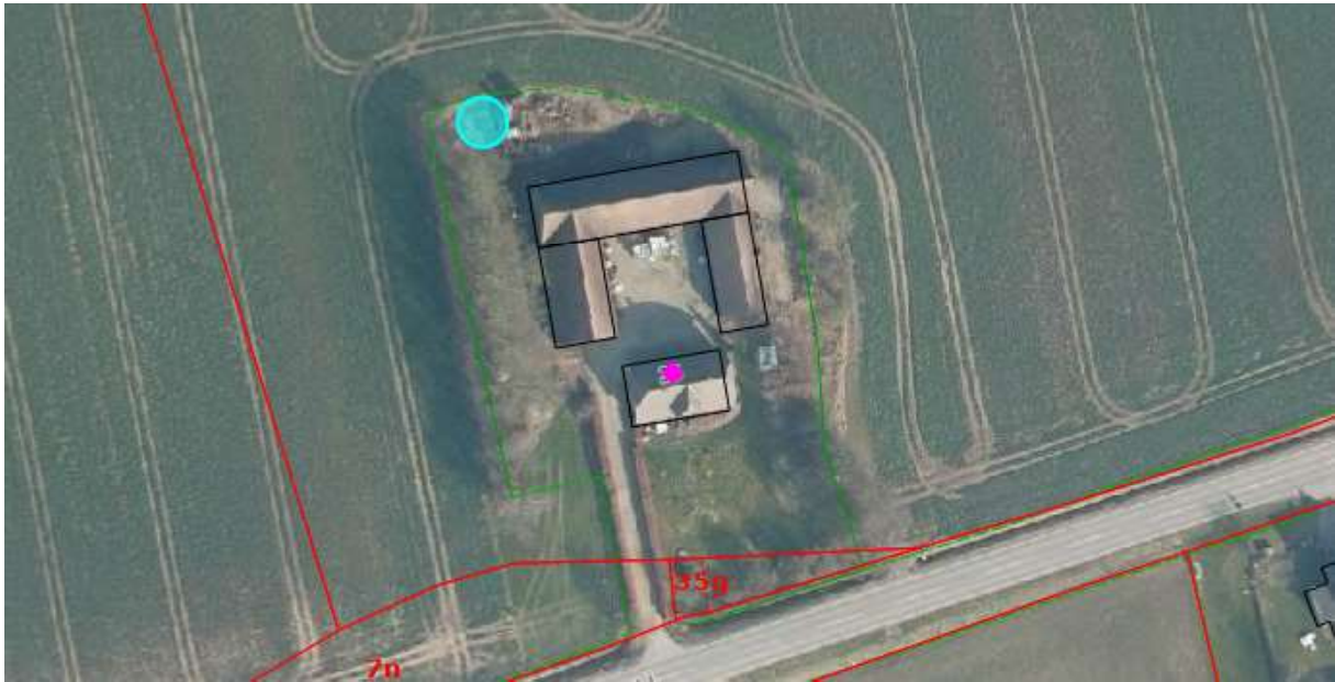
Turkis cirkel viser den ansøgte placering af mast med tilhørende teknikskabe på luftfoto fra 2022