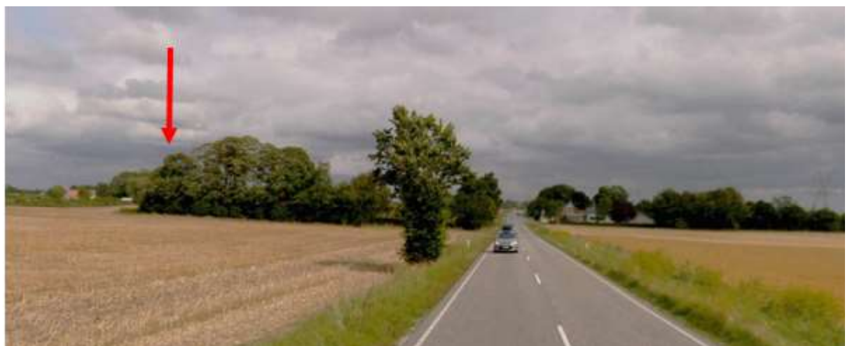
Mastens placering (rød pil) på foto fra COWI set fra Korningvej fra vest mod øst