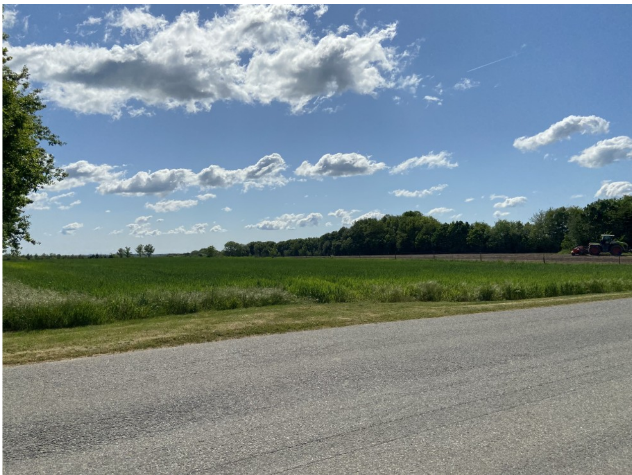
Lokalplanområdet set fra Kirkevej.