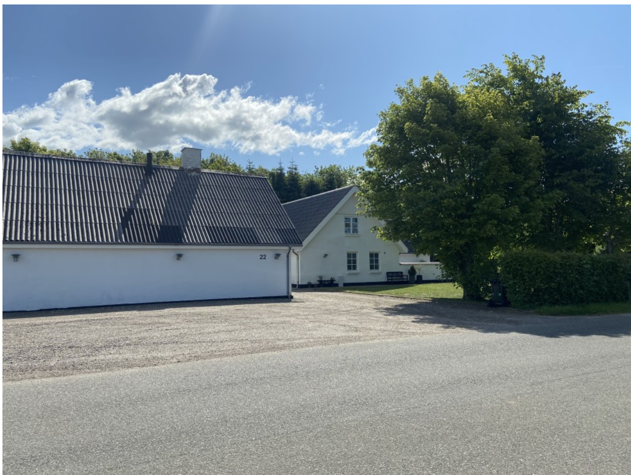
Den eksisterende landejendom set fra Kirkevej.