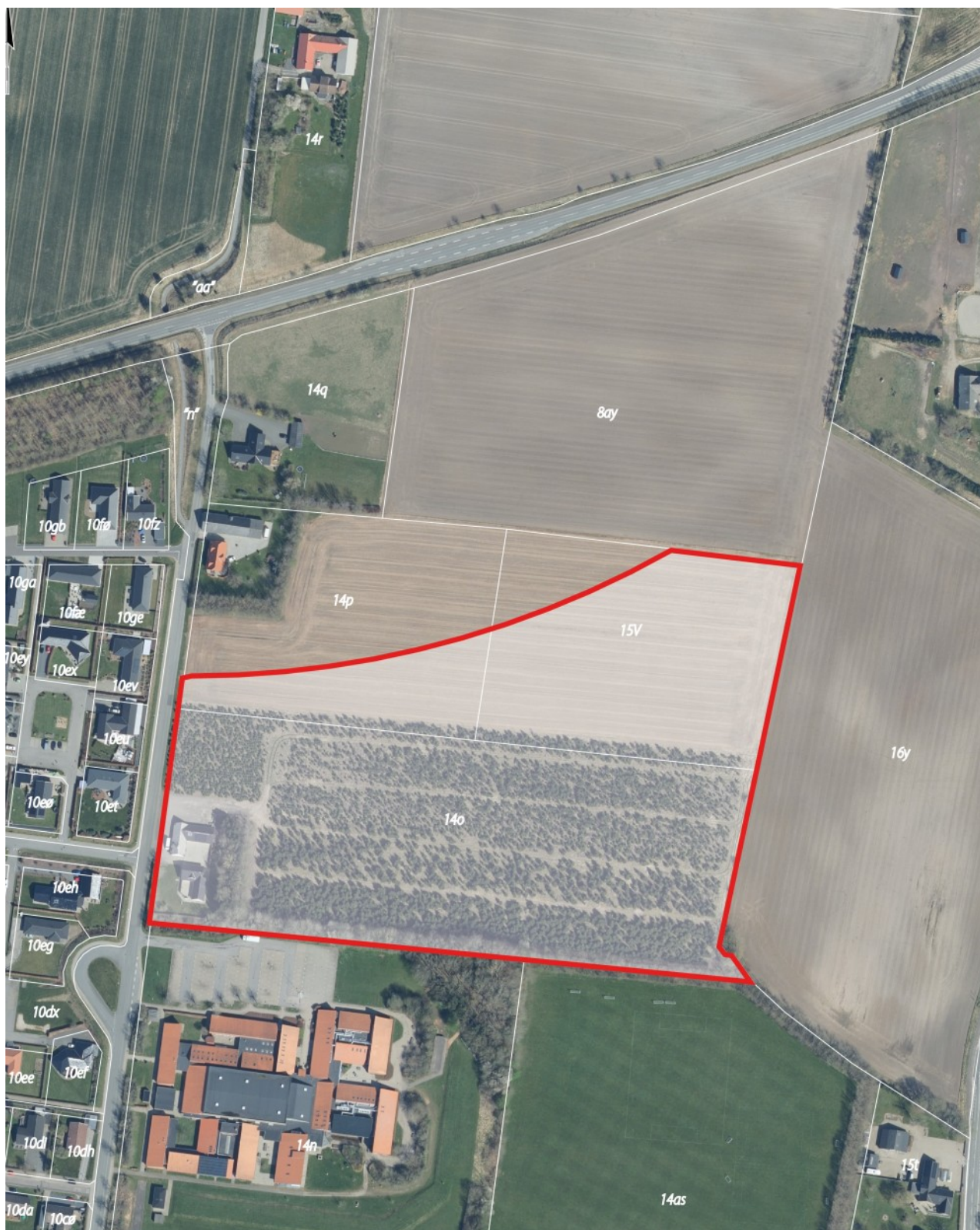
Lokalplanområdet ses markeret med en rød streg.