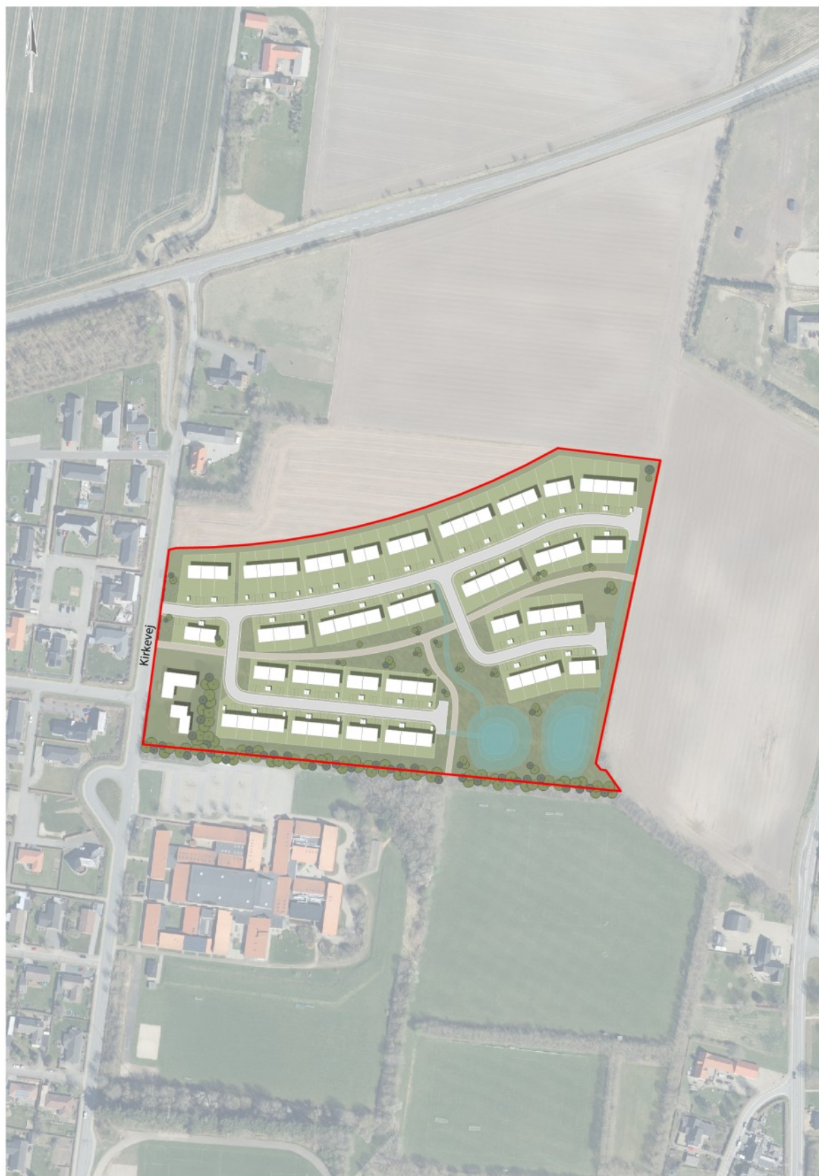
Illustration af lokalplanområdets disponering