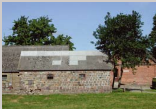
Kampestensbyggeri er karakteristisk for egnen. Her er fin lille udbygning, fundamentet trænger dog til en reparation.

Udarbejdet af Juelsminde Kommune - november 2005