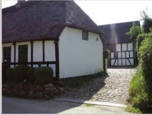
Houmarksvej 8 er særdeles velholdt i den oprindelige stil med udbygning og gårdsplads.

Læs her om de vejledende retningslinier for byggeri i landsbyer