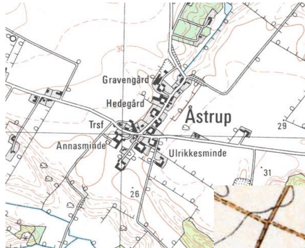
Åstrup 1986 - 1997