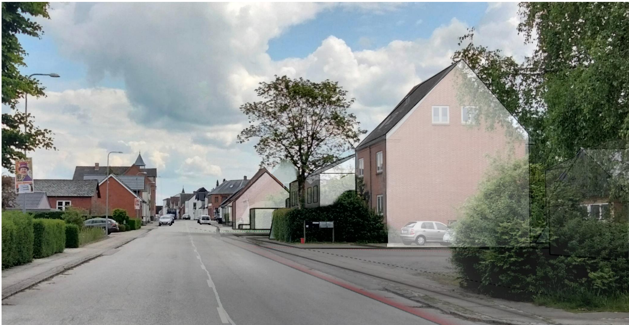
Billedet viser etageboliger med en højde på ca. 8,5 meter og med en byggelinje på 5 meter fra skel til vej- og fortov.