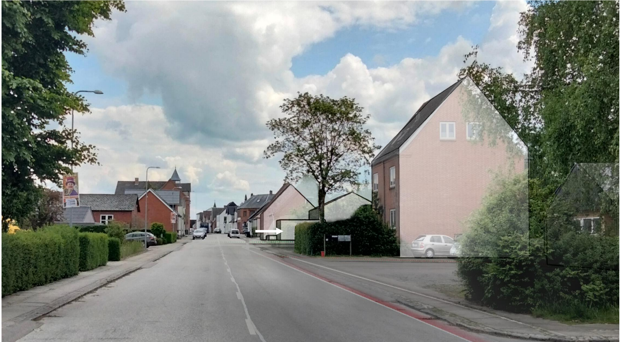
Billedet viser hvordan gadeforløbet langs Vongevej og lokalplanområdet opleves helt åbent og uden hæk