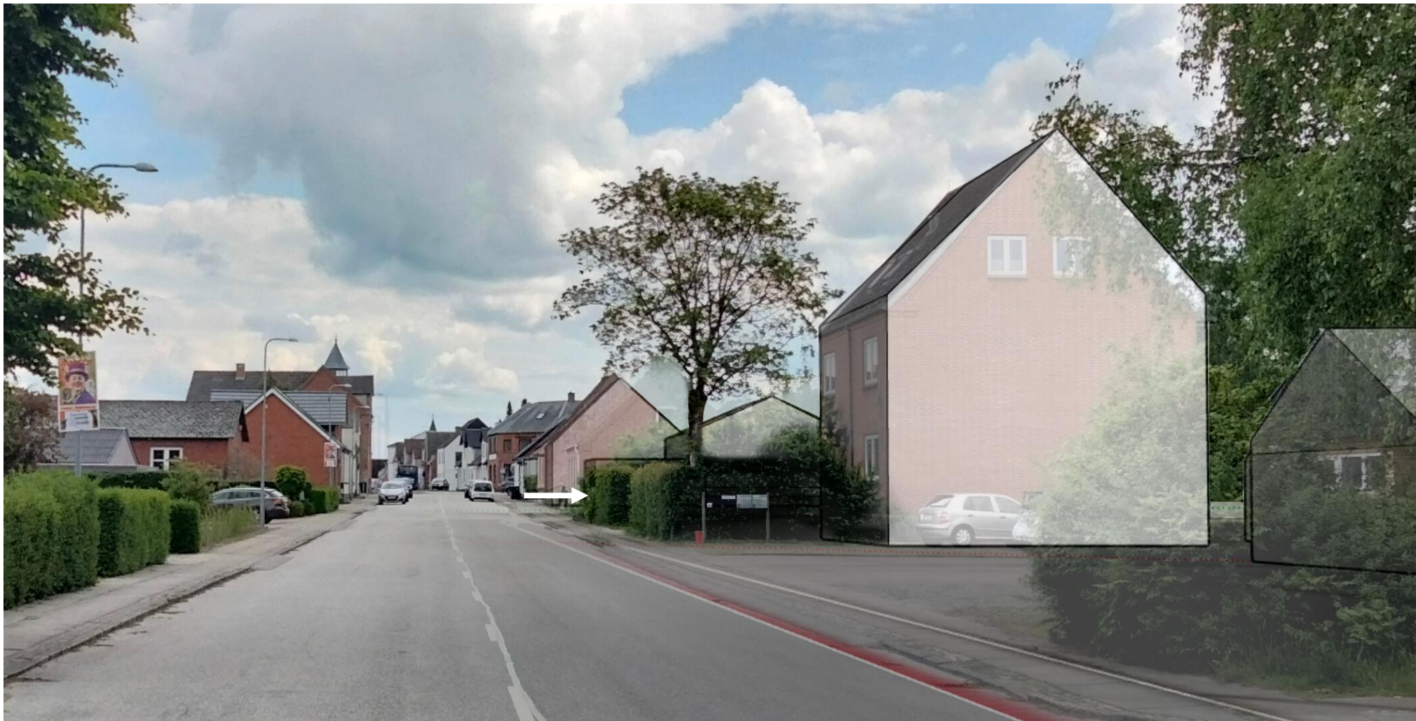
Billedet viser hvordan gadeforløbet opleves mere grønt og mere sammenhængende med hæk