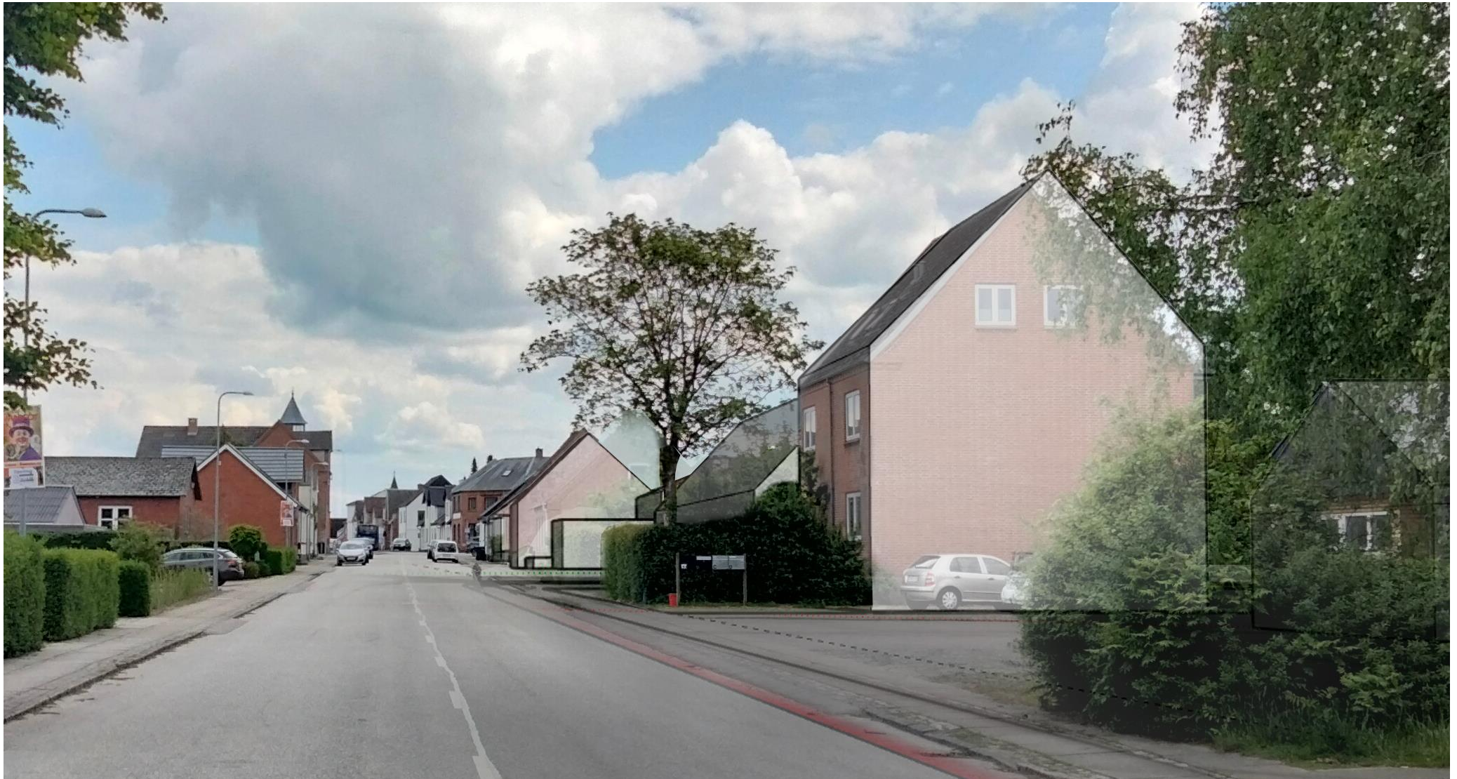
Billedet viser en disponering med tæt-lav bebyggelse der har samme højde som de fleste omkringliggende boliger