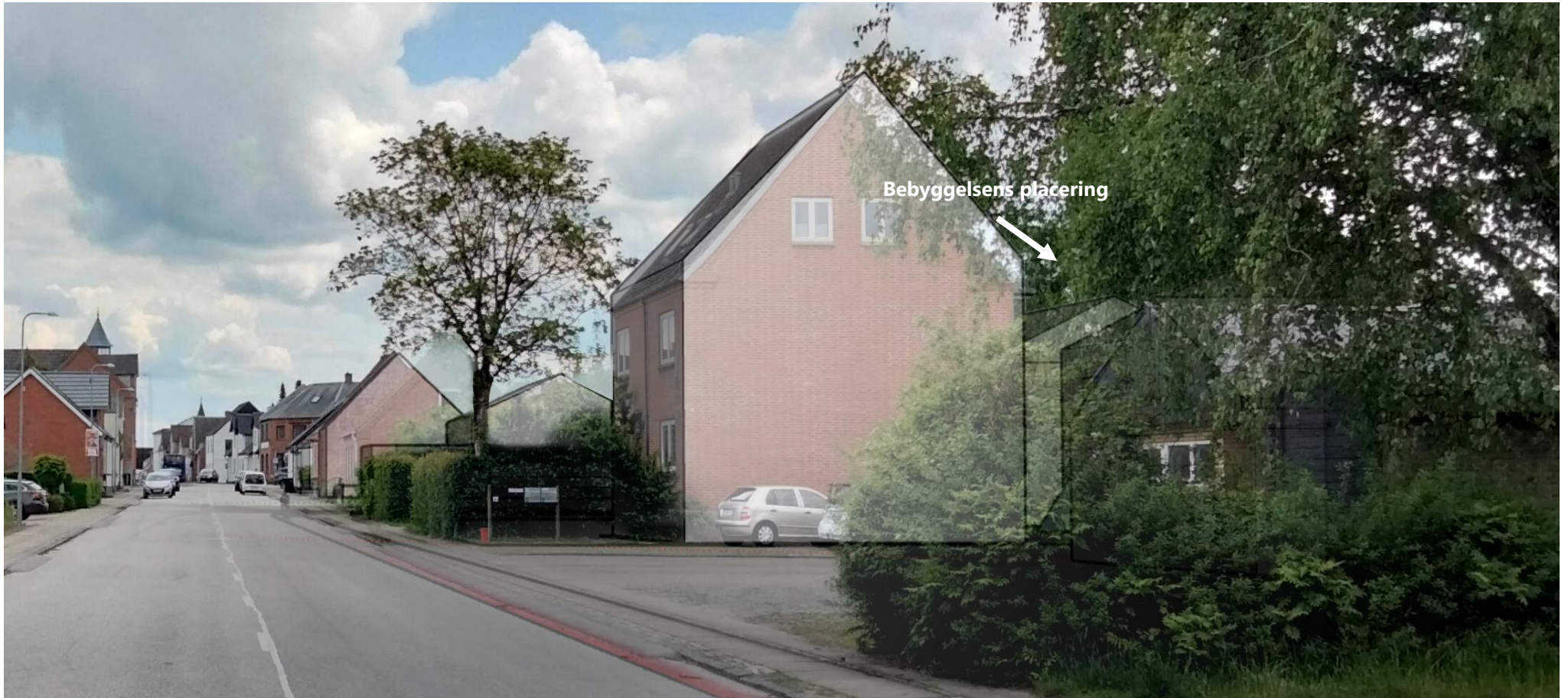
Billedet viser hvordan projektudviklers dispositionsplan opleves langs Vongevej. Bebyggelsen er rykket helt tilbage på grunden, så den ikke opleves og der efterlades et hul i gadeperspektivet.