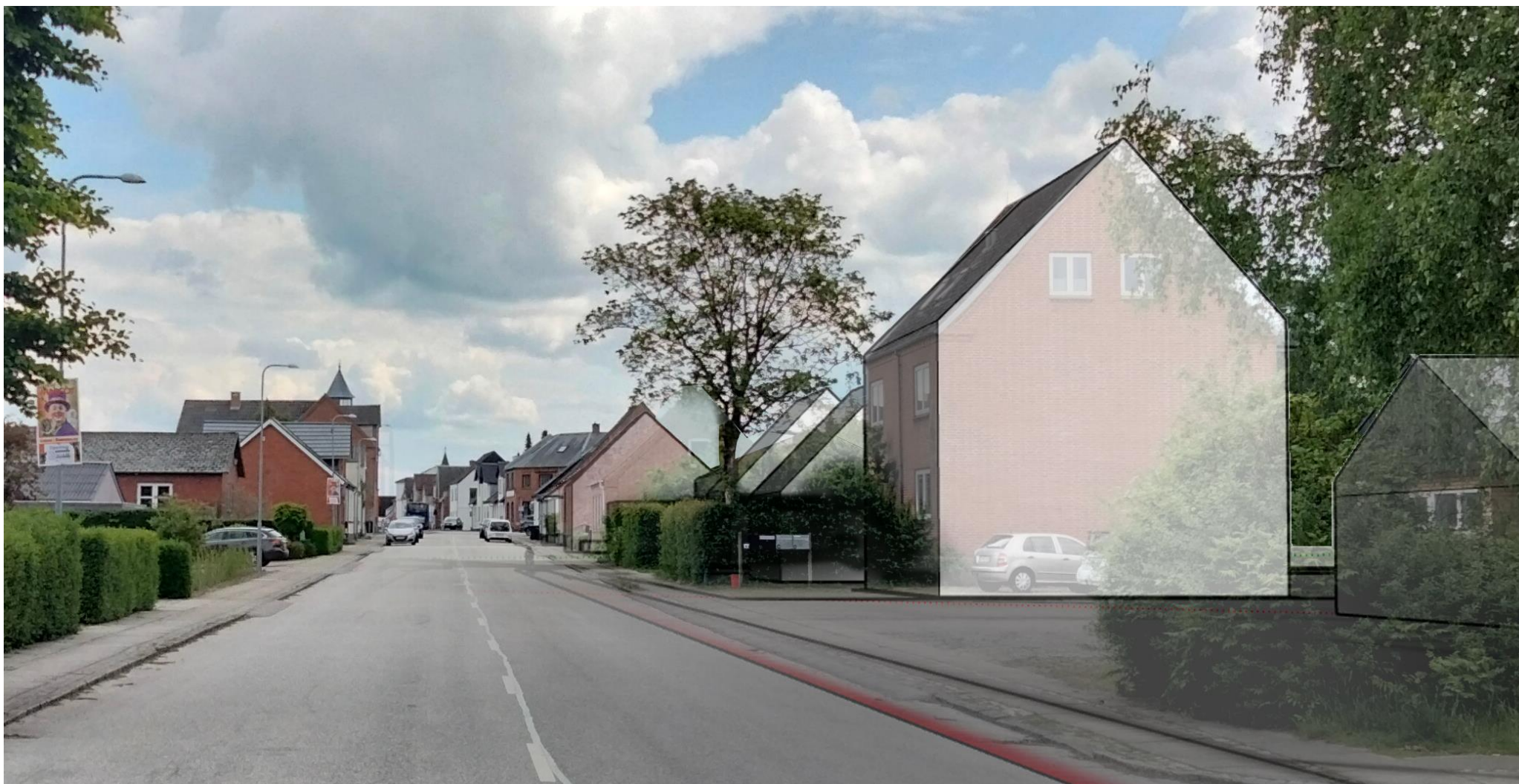
Billedet viser en disponering med åben-lav bebyggelse, der har samme højde som de fleste af de omkringliggende boliger