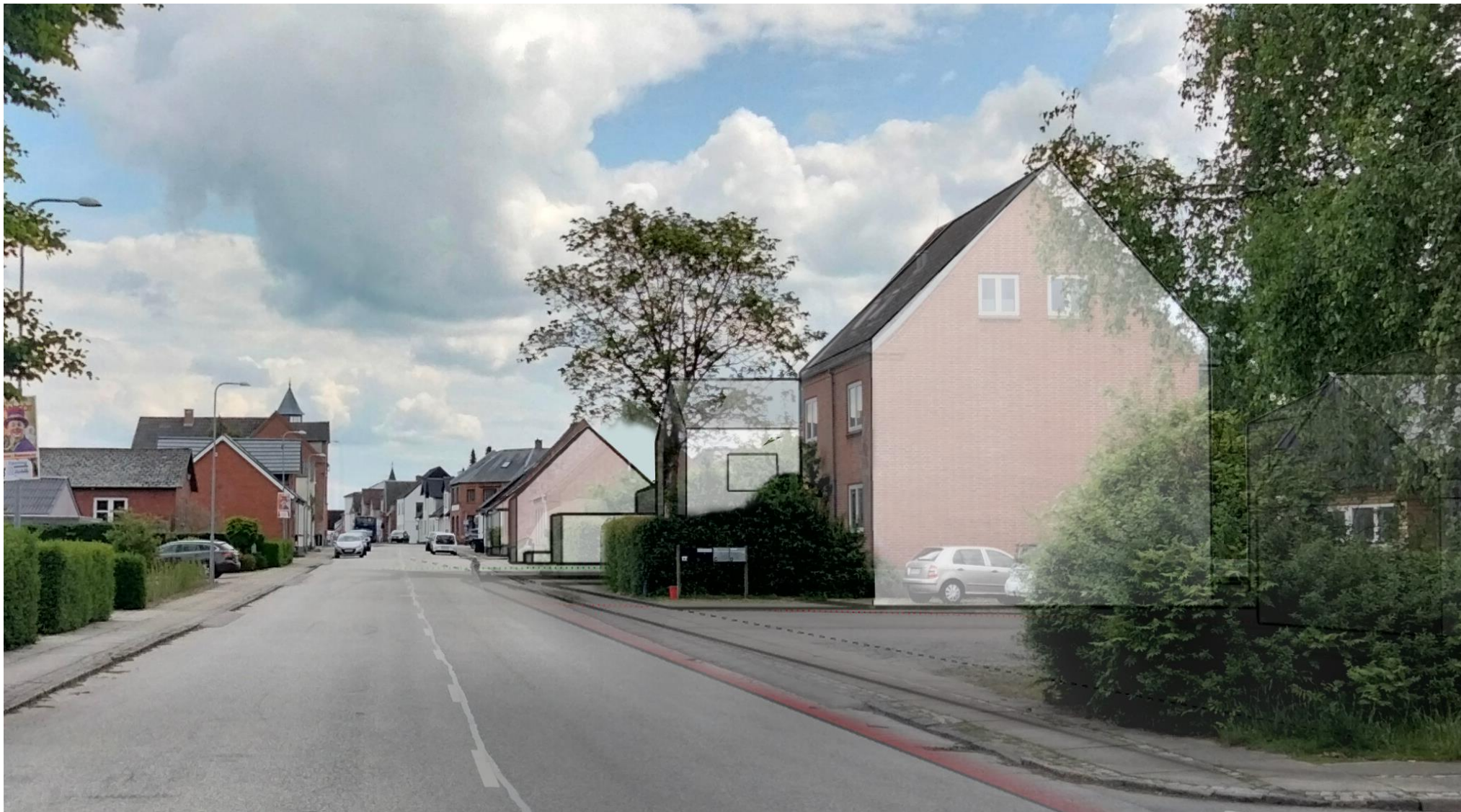
Samme etagebebyggelse der er orienteret med gavl mod vej- og fortov. Dette ændre gadeforløbets rytme, da alle andre ejendomme orienterer sig med omvendt