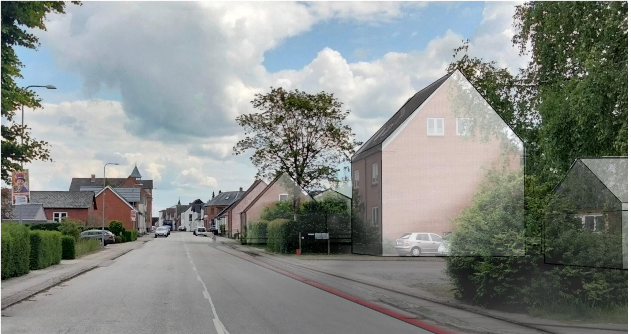
Billedet viser bebyggelsen som den står i dag og hvordan gadeforløbet langs Vongevej opleves fra dette perspektiv