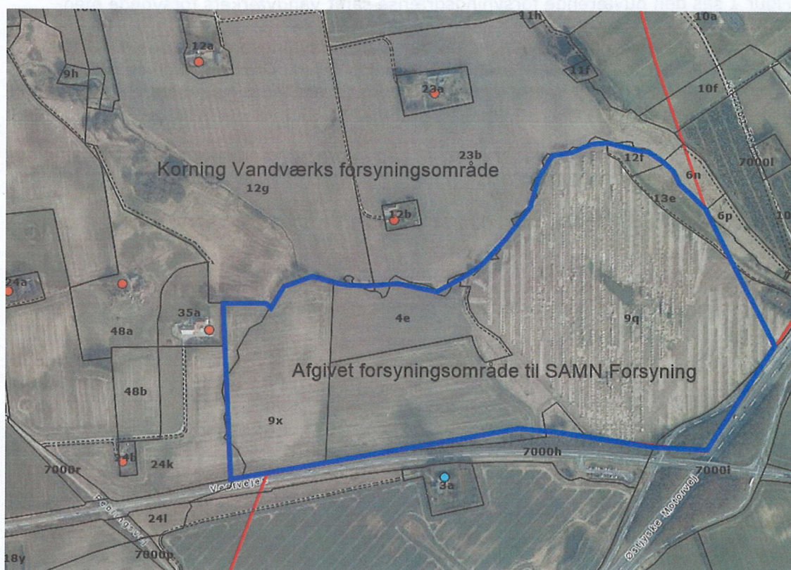
Figur 2 Afgivet forsyningsområde til SAMN Forsyning er markeret med blåt polygon. Korning Vandværks forsynede ejendomme er markeret med orange cirkel.