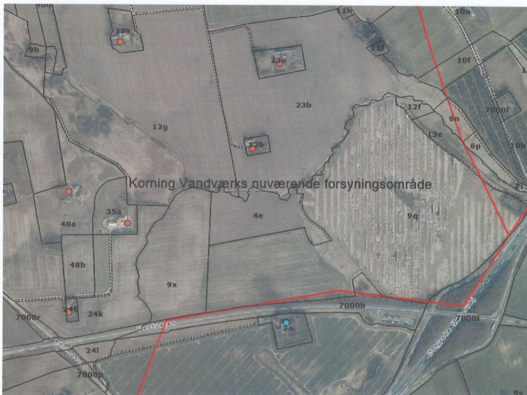
Figur 1 Korning Vandværks nuværende forsyningsområde. Korning Vandværks forsynede ejendomme er markeret med orange cirkel.