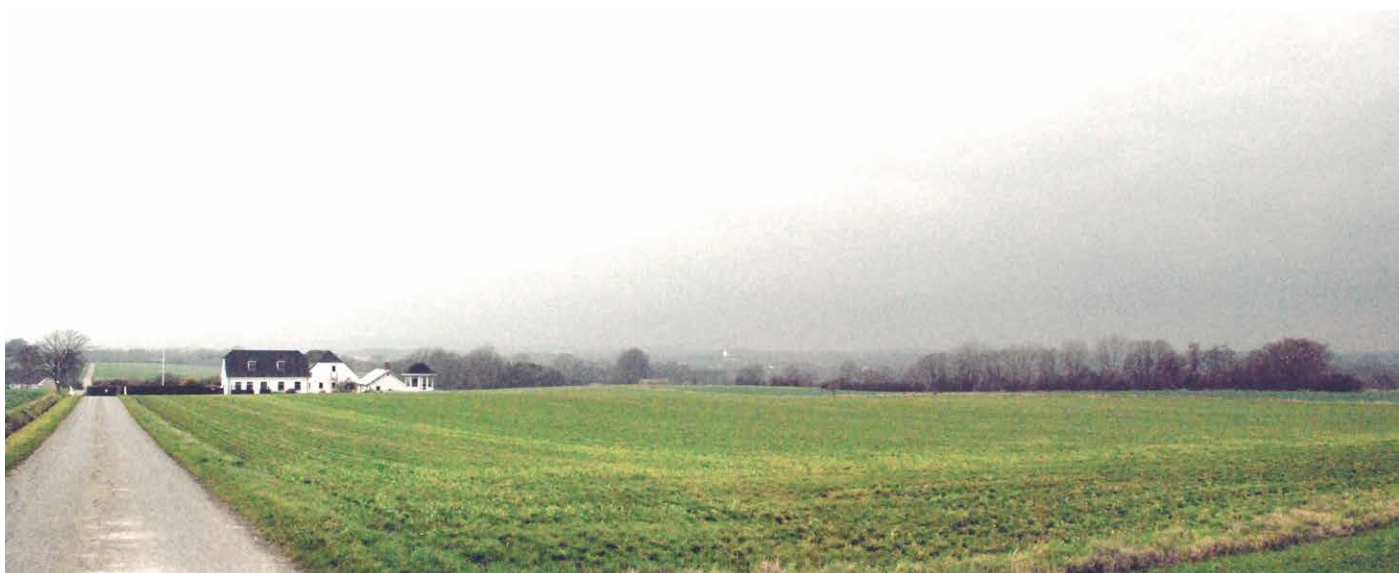
Kulturmiljøer i Hedensted Kommune