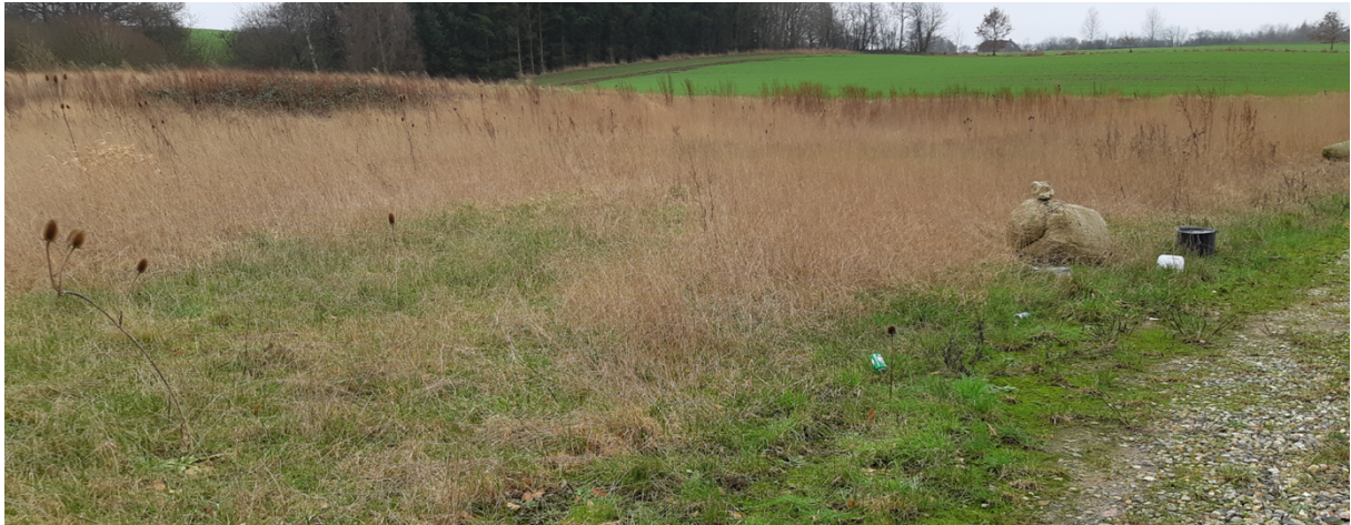
Engkarse i den vestlige del af matriklen, især i lavning ned mod bagvedliggende mark.