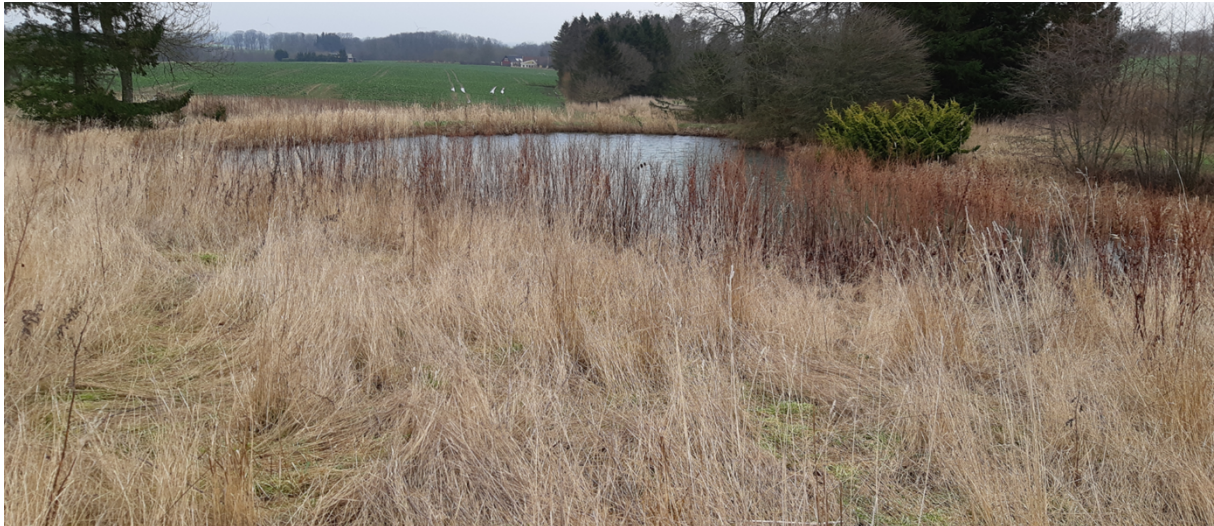
Billedet herover viser søen set fra jordvolden, taget mod nordøst.