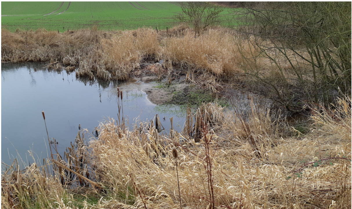
Herover billede af den sydligste ende af søen som går over i rørskov og krat (herunder)