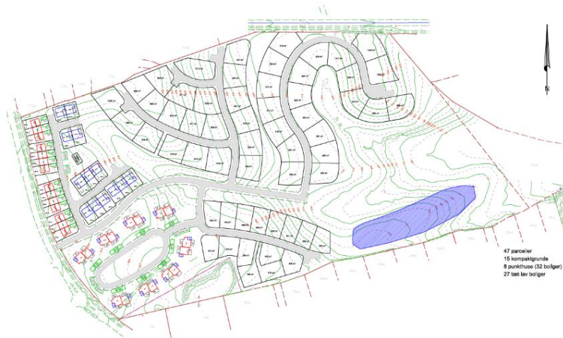
Bebyggelsesplan med punkthuse

Området ønskes udviklet til boligformål. Der er udarbejdet to dispositioner for det ene område, henholdsvis punkthuse i 2 etager med 4 boliger i hver og en med tæt-lav boliger. Bygherre har ikke langt sig fast på en bestemt type/størrelse endnu. Disponeringen tager udgangspunkt i topografien med et småkuperet terræn med slugtdannelser, som munder ud i det lave området op mod skoven. Der er planlagt en stiforløb med tilslutning til Tofteskovvej og den eksisterende sti i det sydøstlige hjørne.