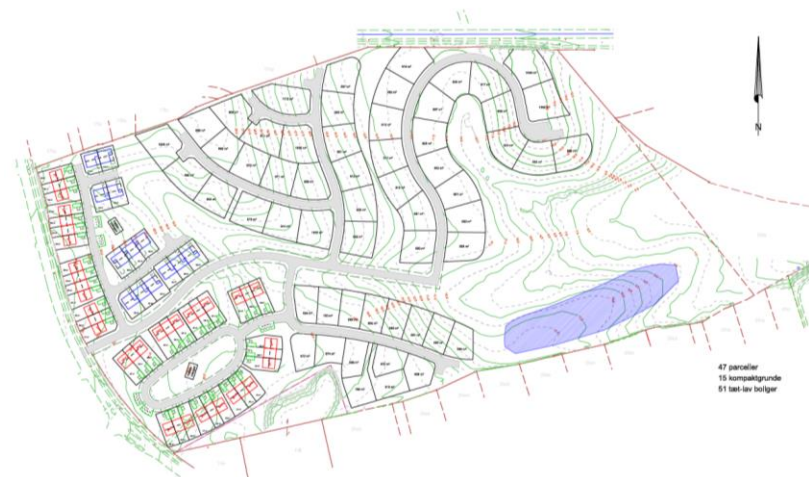
Bebyggelsesplan med tæt-lav

Lokalplanen omfatter matrikel nr. 20a, Klakring By, Klakring. Området er beliggende centralt i Juelsminde, hvor det er omkranset af eksisterende by. Arealet afgrænses af Tofteskovvej mod nord og Petersmindevej mod vest, samt eksisterende boliger syd og skov mod øst. Arealet anvendes i dag til dyrket landbrugsjord.