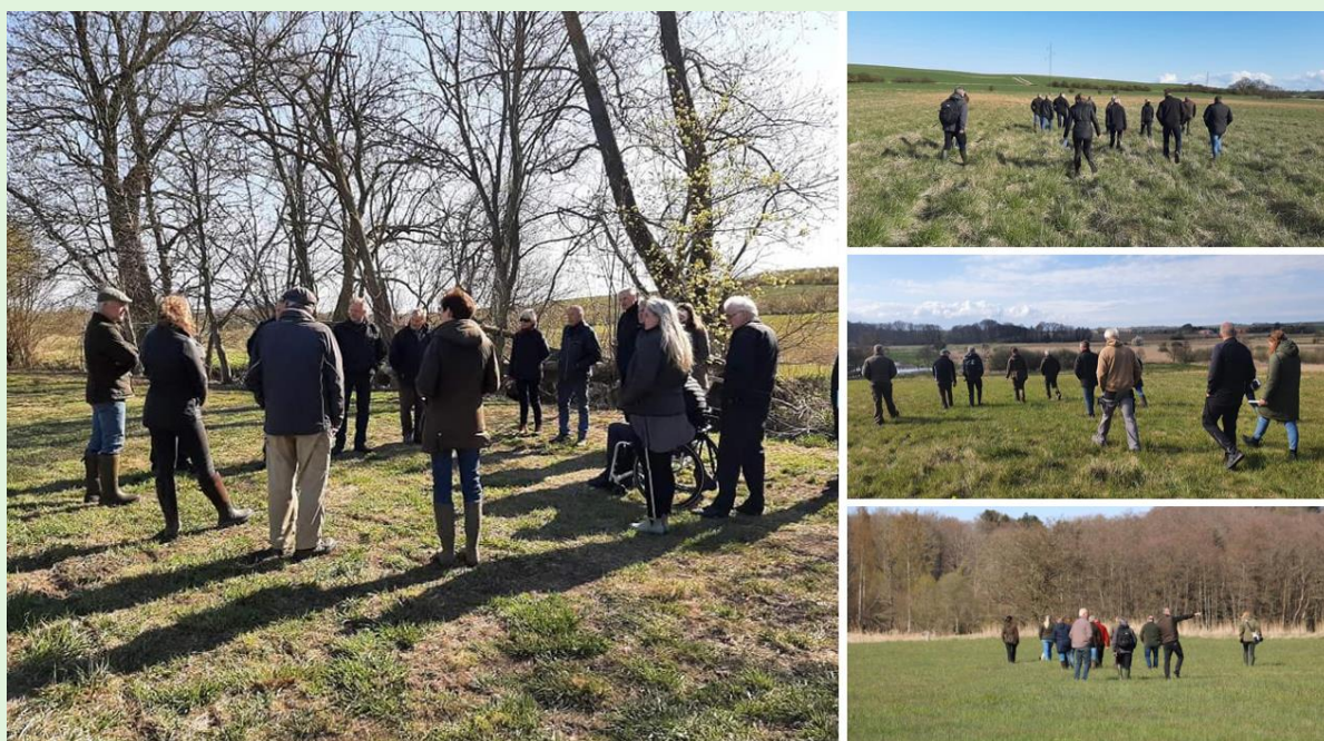
Figur 2 - Markvandring i foråret 2021 ved As Vig