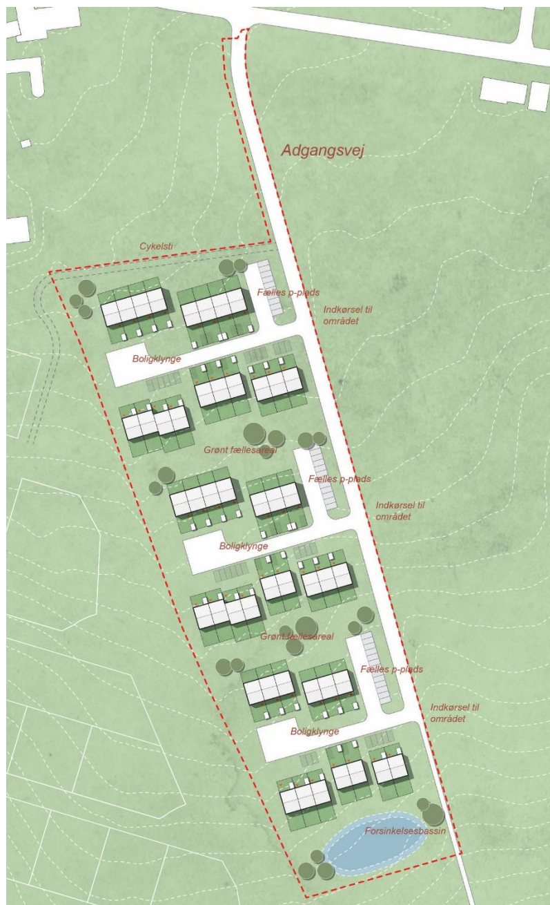
Illustrationsplan (ikke målfast).