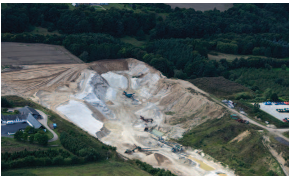
Råstofgrav i råstofgraveområde Tandskov i Silkeborg kommune (foto fra august 2014).

Har du forslag til andre nye fremtidige råstofgraveområder?