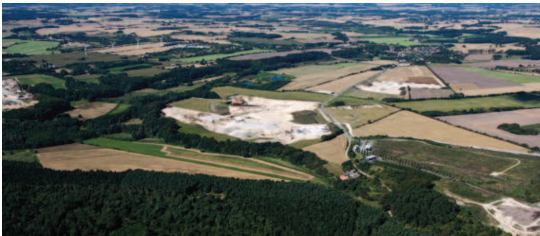
Råstofgrave i råstofgraveområde Glatved i Norddjurs kommune (foto fra august 2014).

På regionens hjemmeside på internetadressen: www.raastofplan-midt.dk ses både gældende råstofgraveområder og råstofinteresseområder.