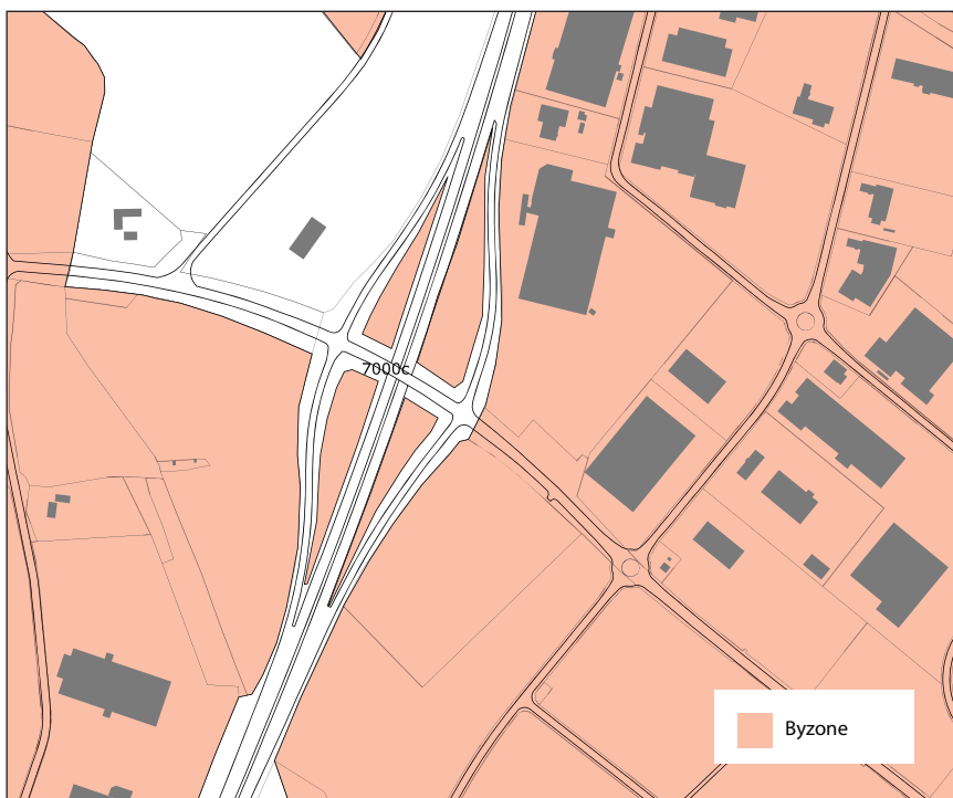
Nuværende zonekort med byzone

For det aflyste areal gælder herefter Planoven § 35 stk. 1 om landzoneadministration samt de generelle bestemmelser i bygningsreglementet.