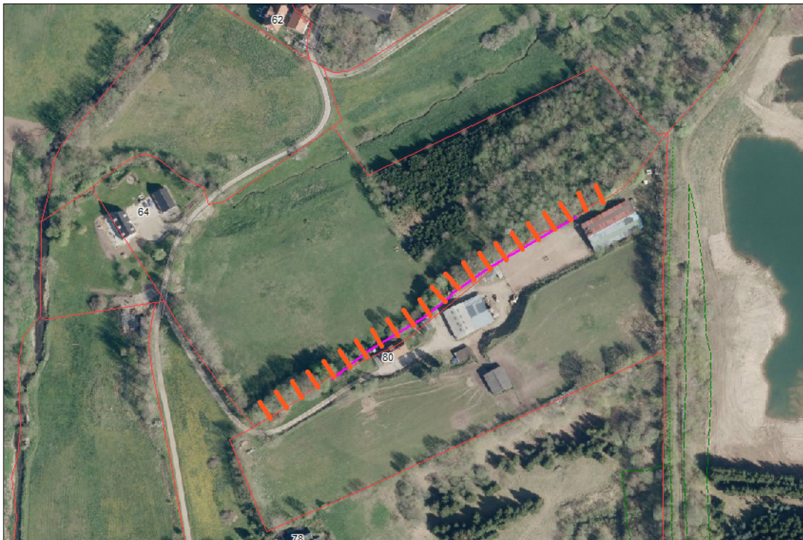
Luftfoto visende området samt orange markering af placering af skrænten

I denne sag har Hedensted Kommune efter besigtigelse den 16. april 2015 vurderet, at der ikke kræves landzonetilladelse til terrænregulering af eksisterende skrænt som cirka måler ca.250 meter i sin fulde længde og er beliggende på matr.nr. 5G Ørum By, Ørum, Ørumvej 64, 8721 Daugård grænsende op mod matr.nr. 23 Ørum By, Ørum, Ørumvej 80, 8721 Daugård.