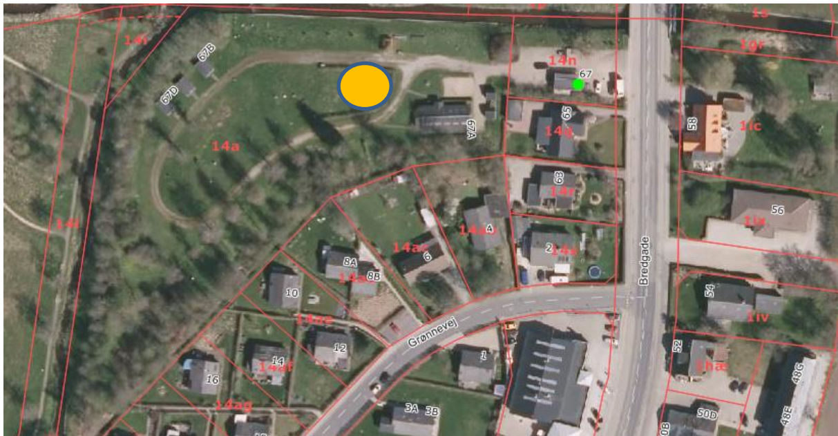
Ortofoto 2018: Orange cirkel viser ca. placering for tipi

Der er ansøgt om tilladelse til at opstille en tipi/et telt på Tørring Camping (Bilag 2 – Indstillingsnotat). Tipien ønskes opstillet i campingsæsonen og til enkelte ekstra arrangementer (Bilag 3 – Ansøgning). Tipien sættes op i tilknytning til eksisterende bebyggelse på ejendommen, se nedenstående kort med ønsket placering: