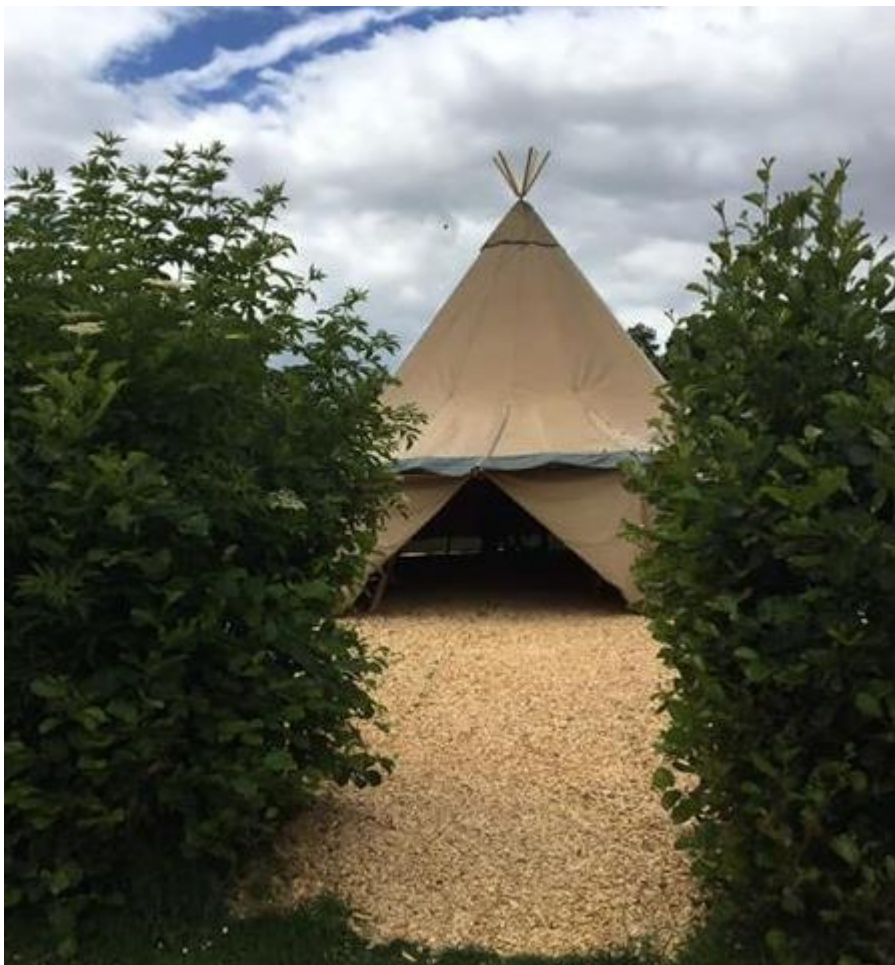
Foto af tipi bag beplantning