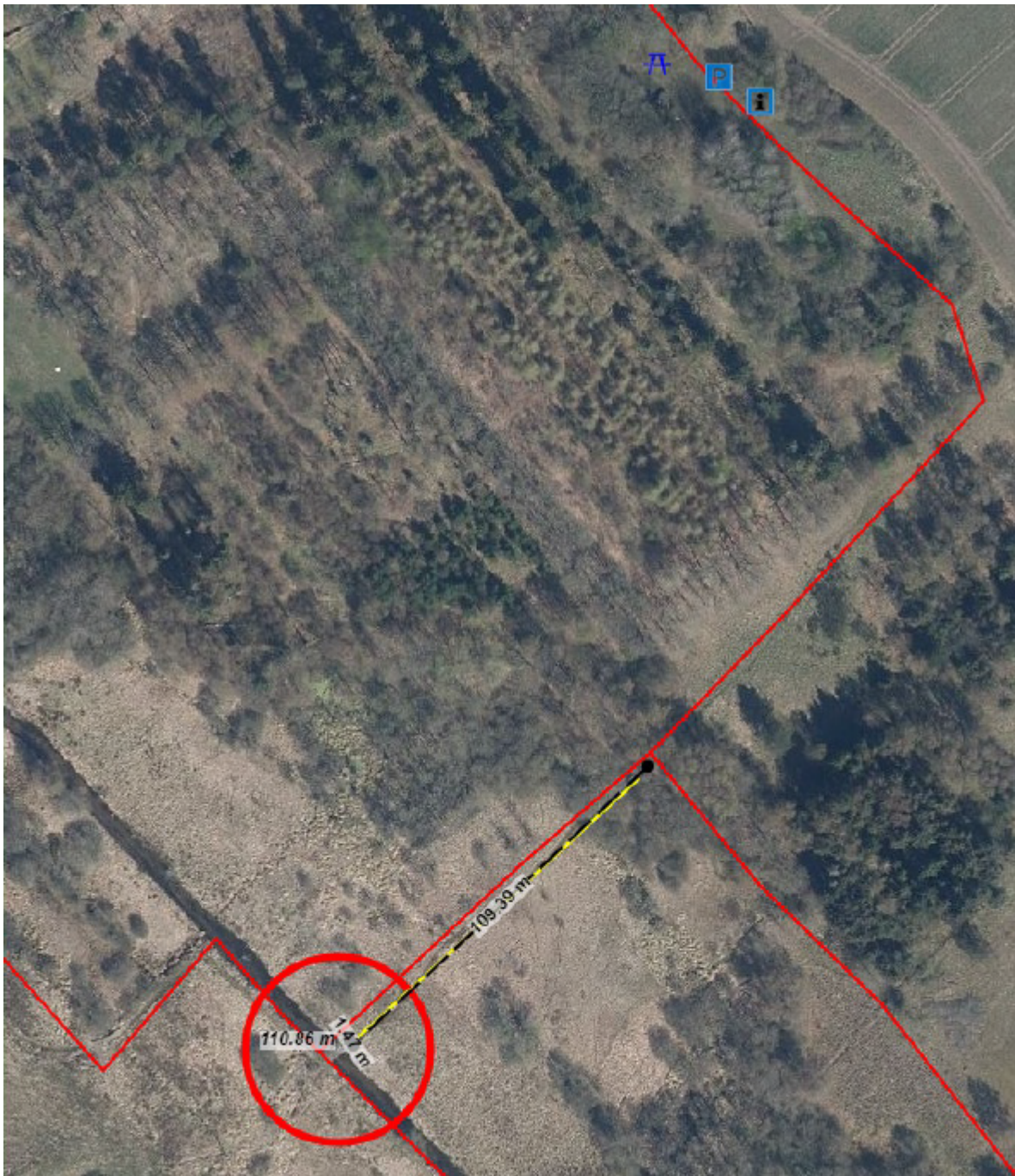
Ny bro over Gudenå (ved cirkel) og nyt træspang på sti i Hedensted Kommune.

*Udskiftning af bro til Vejle Kommune og etablering af træspang ved Jomfruhale