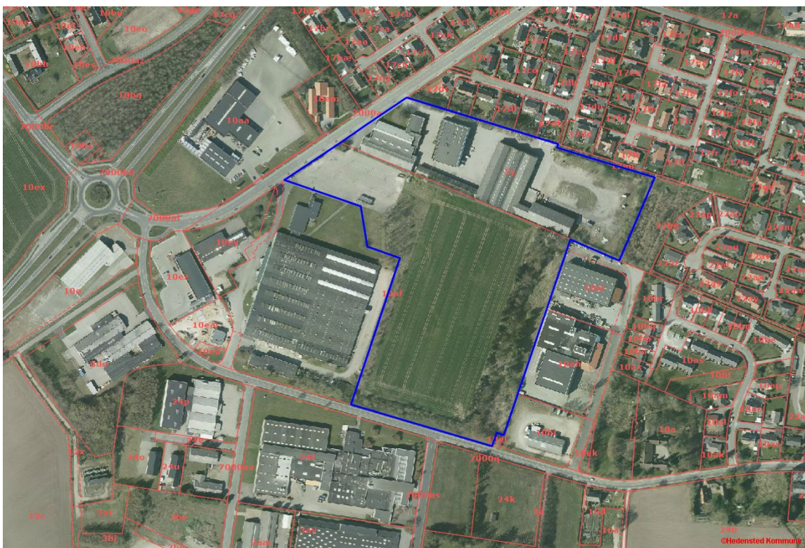
Afgrensning af kommuneplantillæg.

I forbindelse med kommuneplantillæg nr. 29 udarbejdes lokalplan 1151 som sikrer områdets anvendelse til boligområde. Lokalplanområdet er opdelt i to delområder, hvoraf kun delområde I er byggeretsgivende. Delområde II fastlægger rammebestemmelser, der skal overholdes i fremtidige detaillokalplaner. Lokalplanen vil sikre minimering af miljømæssige påvirkninger, grønne fælles fri- og opholdsarealer, veje, stier og parkeringsforhold samt regnvandshåndtering.