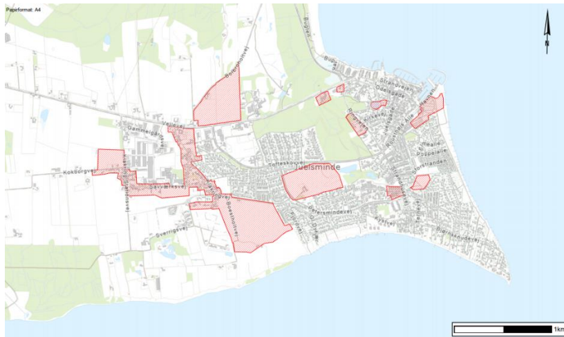
Retningslinje 1.1 - Byudvikling og byzone