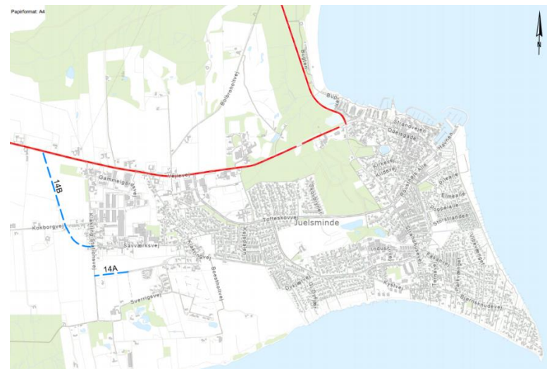
Retningslinje 12.1 Trafikanlæg ændres i forhold til vej- og trafikplan 2020-2030