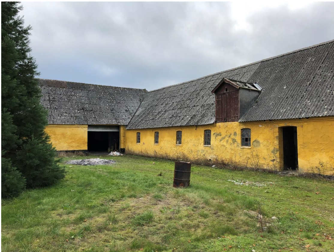
Gårdspladsen med den vestlige og del af sydlige længel