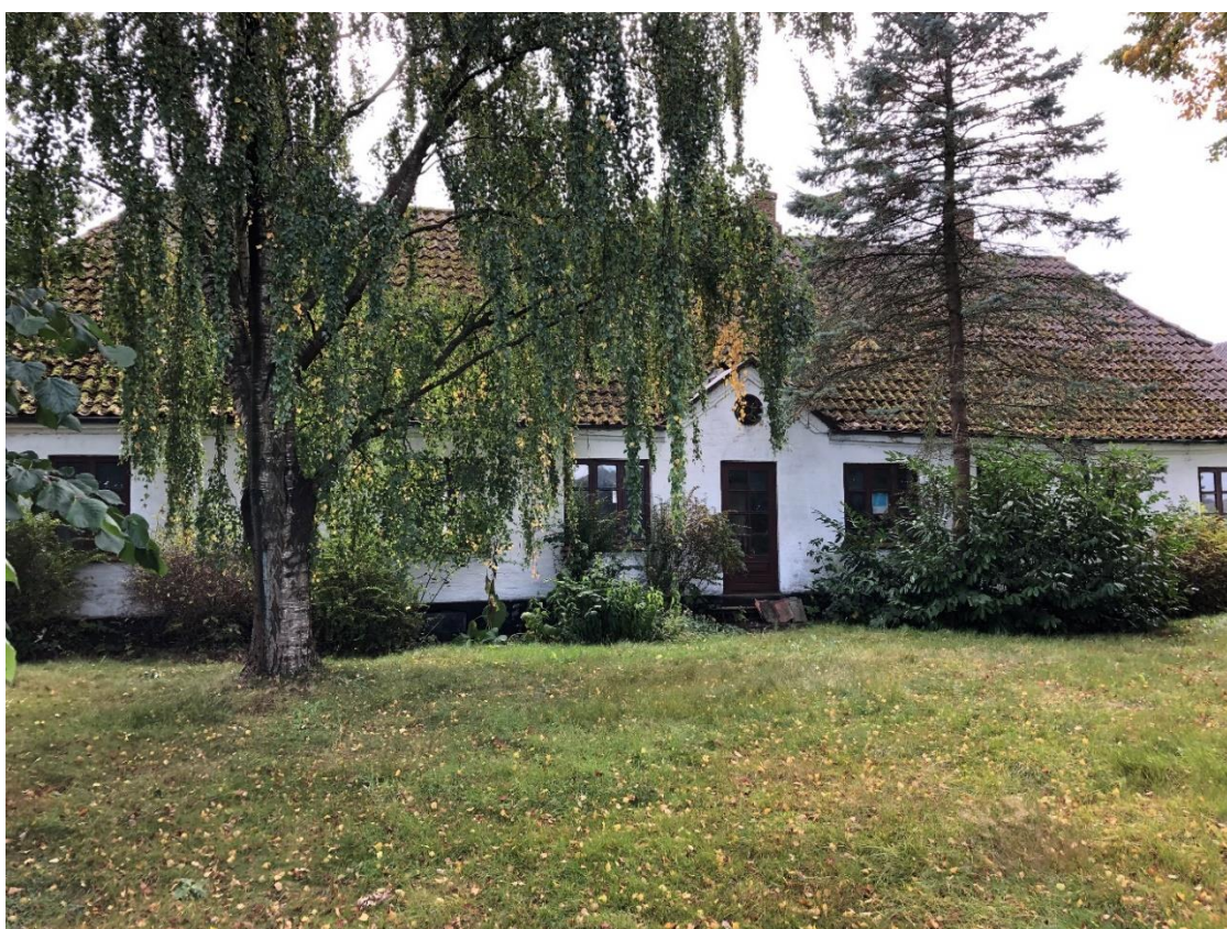
Stuehuset set fra haveside