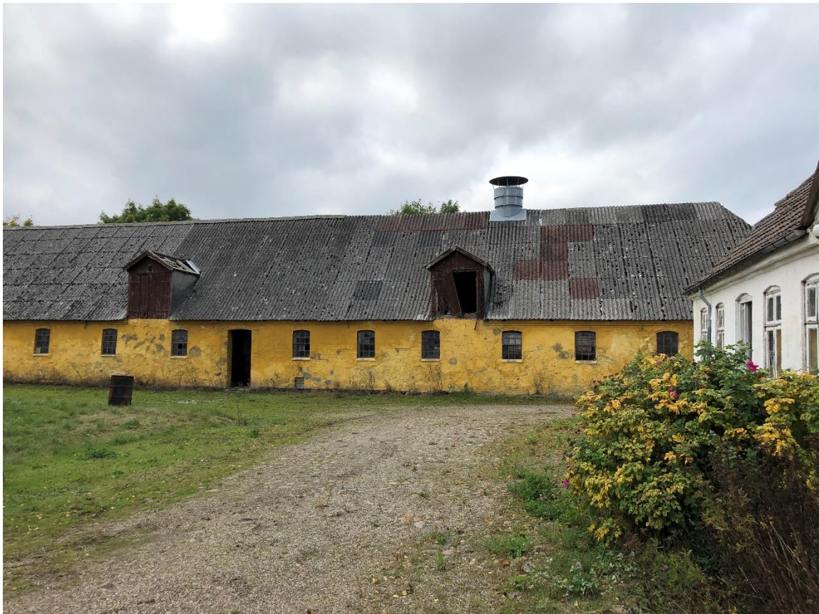
Den vestlige længe set fra gårdspladsen