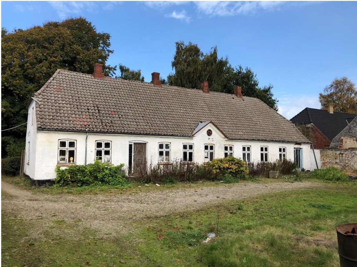
Stuehuset set fra gårdspladsen

Hedensted Kommune har modtaget en ansøgning om nedrivning af det bevaringsværdige stuehus på ejendommen Vrigsted Vestergaard, Overvej 7, 7140 Stouby, matr.nr. 8a, Vrigsted By, Vrigsted. Ansøger ønsker at nedrive hovedhuset og de øvrige længer på ejendommen. Hovedhuset er udpeget som bevaringsværdig bygning i Hedensted Kommuneplan 2017-2029. Det betyder, at kommunen i henhold til Lov om bygningsfredning og bevaring af bygninger og bymiljøer, § 18 stk. 3 skal offentliggøre nedrivningsanmeldelsen inden der træffes beslutning i sagen.