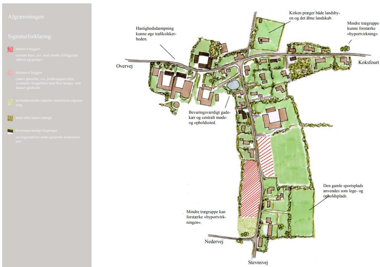
Kort med afgrænsningen fra landsbykataloget for Over Vrigsted