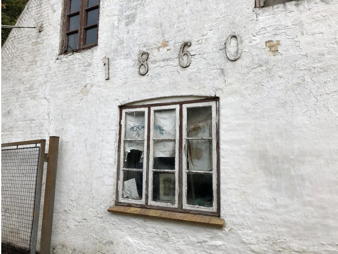
Bygningsdetaljer på hovedhuset vestlige gavl