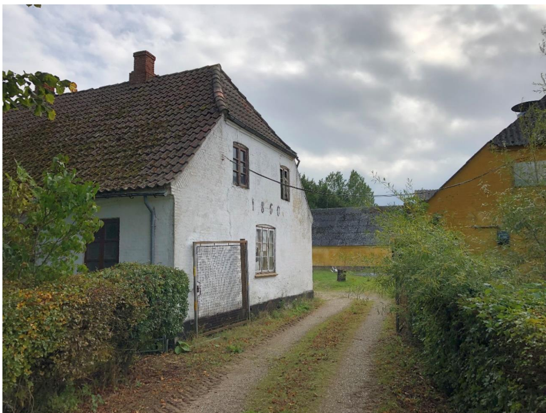
Ejendommen set fra Overvej