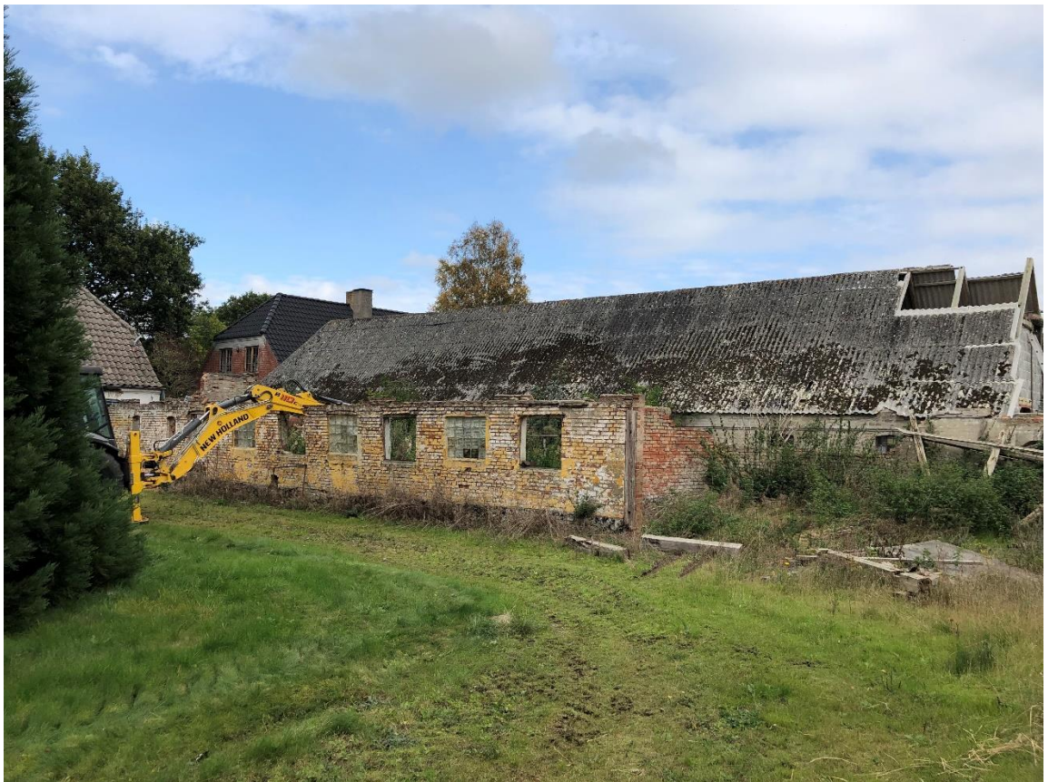
Den østlige længe set fra gårdspladsen