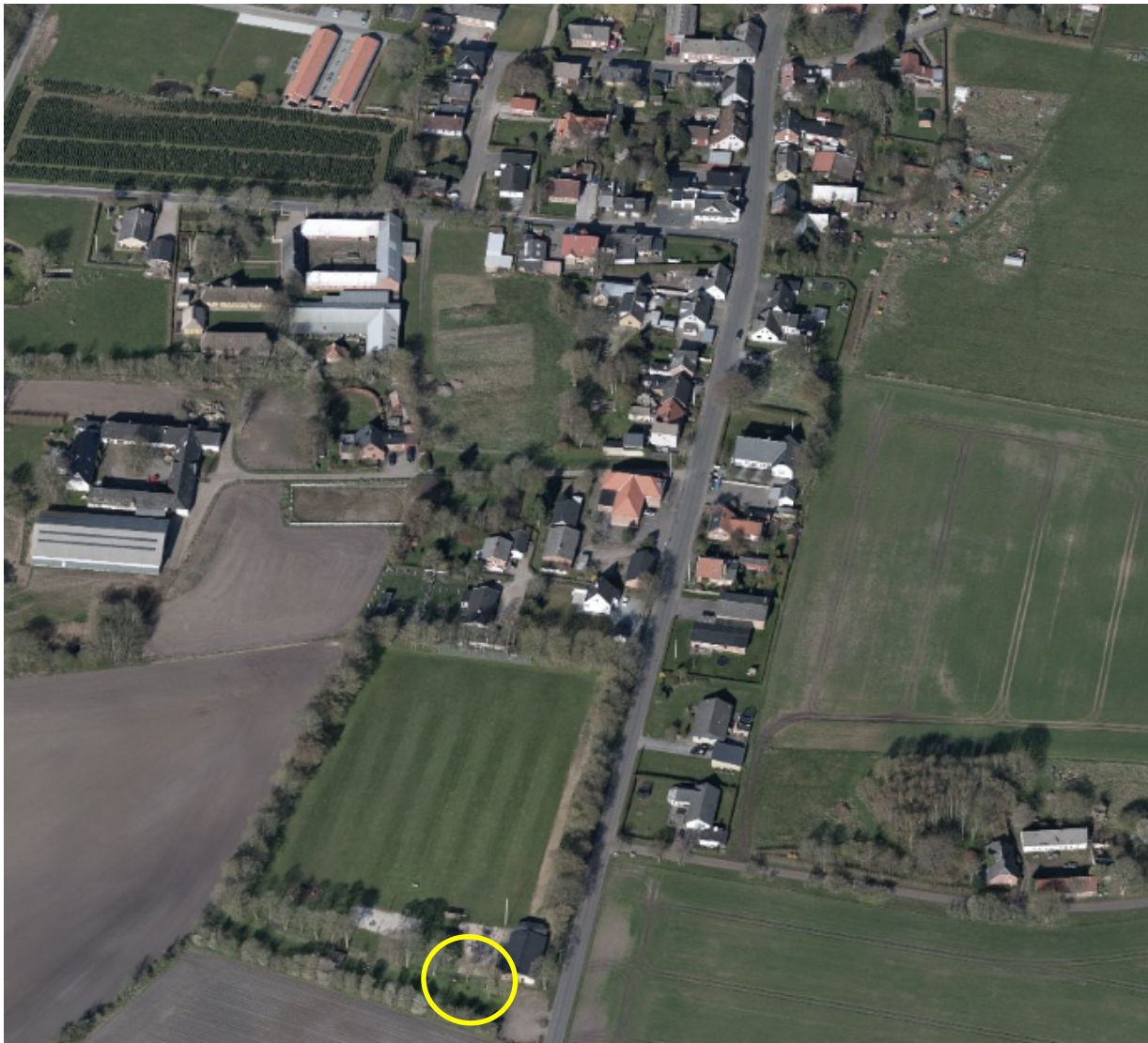
Skråfoto fra 2019 viser placering af telemast med gul cirkel