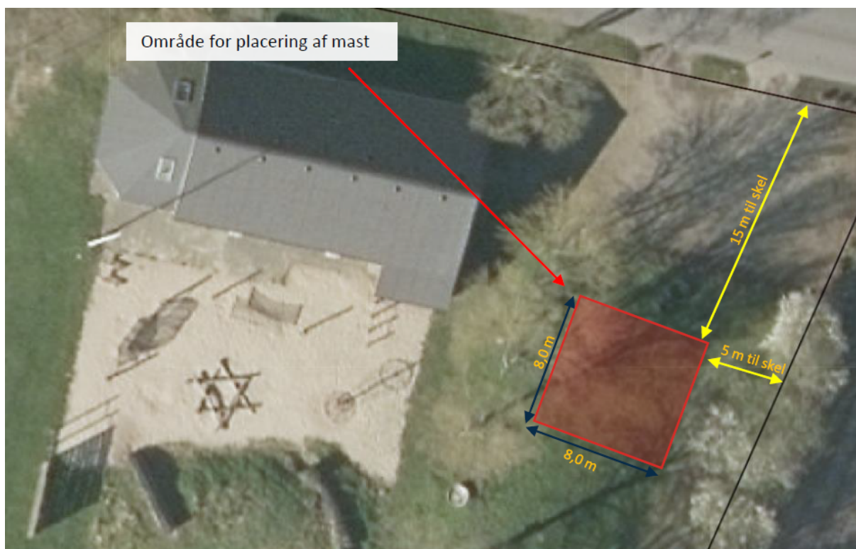
Ansøgers situationsplan – telemastens placering er vist med rød firkant