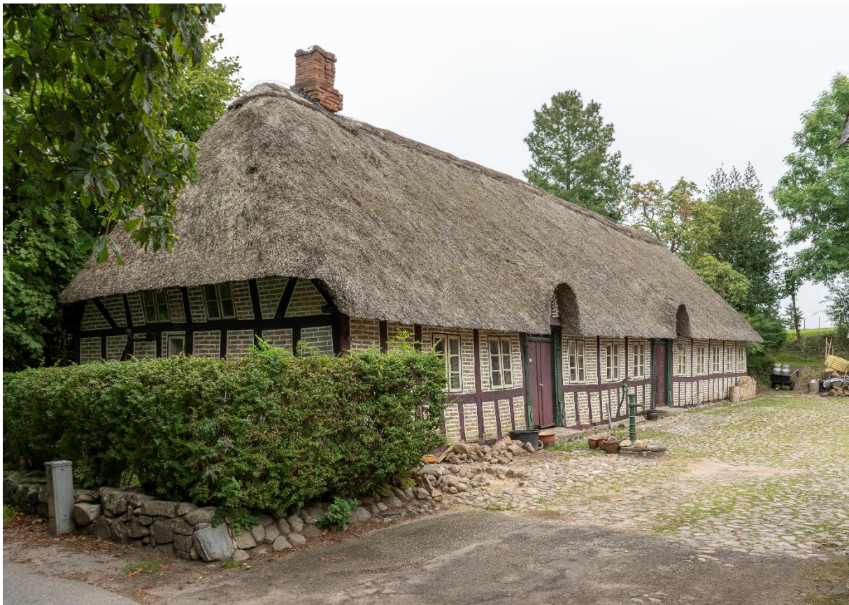
Stuehuset set fra Houmarksvej

Bevaringsværdig bygning på Houmarksvej 2, 7130 Juelsminde er ansøgt delvist nedrevet.