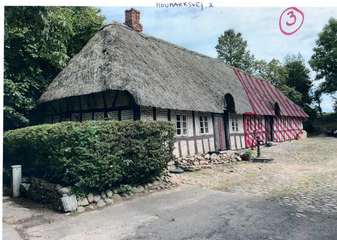
Set fra vejen. Den ønskede nedrivning angives med rød skravering