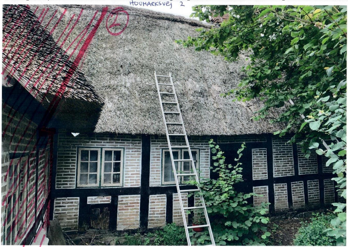
Set fra haven. Set fra gårdspladen. Den ønskede nedrivning angives med rød skravering