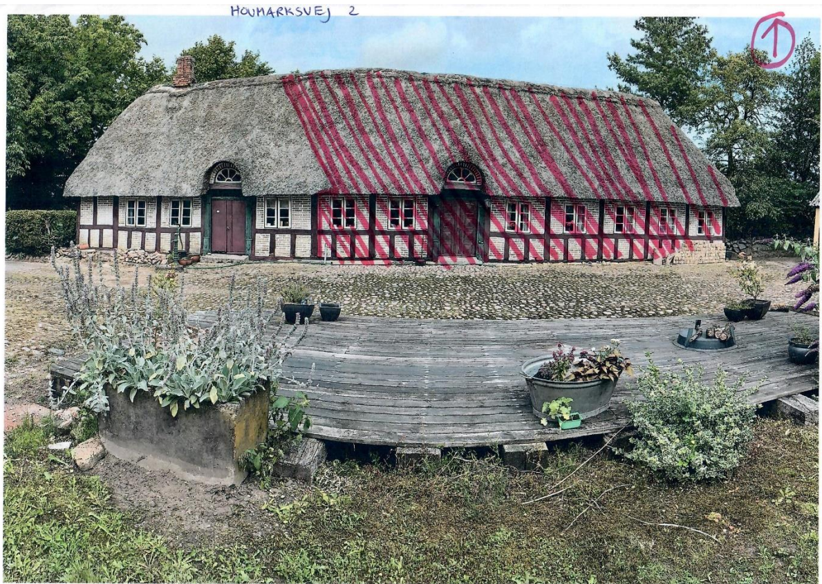
Set fra gårdspladen. Den ønskede nedrivning angives med rød skravering