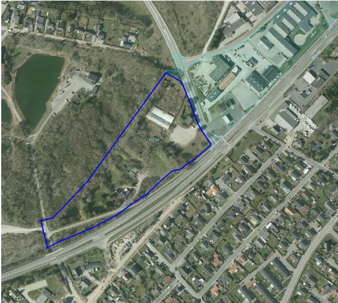
Fremtidig afgrænsning af detailhandelsstruktur med mørkeblå markering for kommuneplantillægget.

Retningslinje udpegningen til detailhandelsstrukturen for Hedensted-nord har et areal på ca. 7,5 ha, dette reduceres ved den endelige vedtagelse af dette kommuneplantillæg til ca. 4,1 ha.