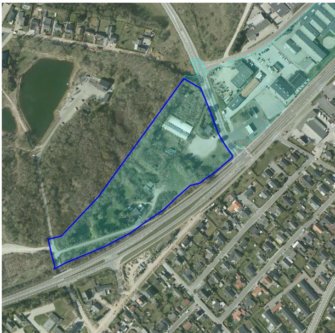
Nuværende afgrænsning for detailhandelsstruktur for området med mørkeblå markering for kommuneplantillægget.

Da planlægningen for området ændre anvendelse, skal detailhandelsstrukturen også ændres. Området har indtil videre været et erhvervsområde, med mulighed for etablering af særlig pladskrævende varegrupper. Med en arealanvendelse til boliger er det ikke længere muligt, at placere særlig pladskrævende varegrupper i området. Derfor ændres retningslinje udpegningen for detailhandelsstruktur, som vist på kortene nedenfor.