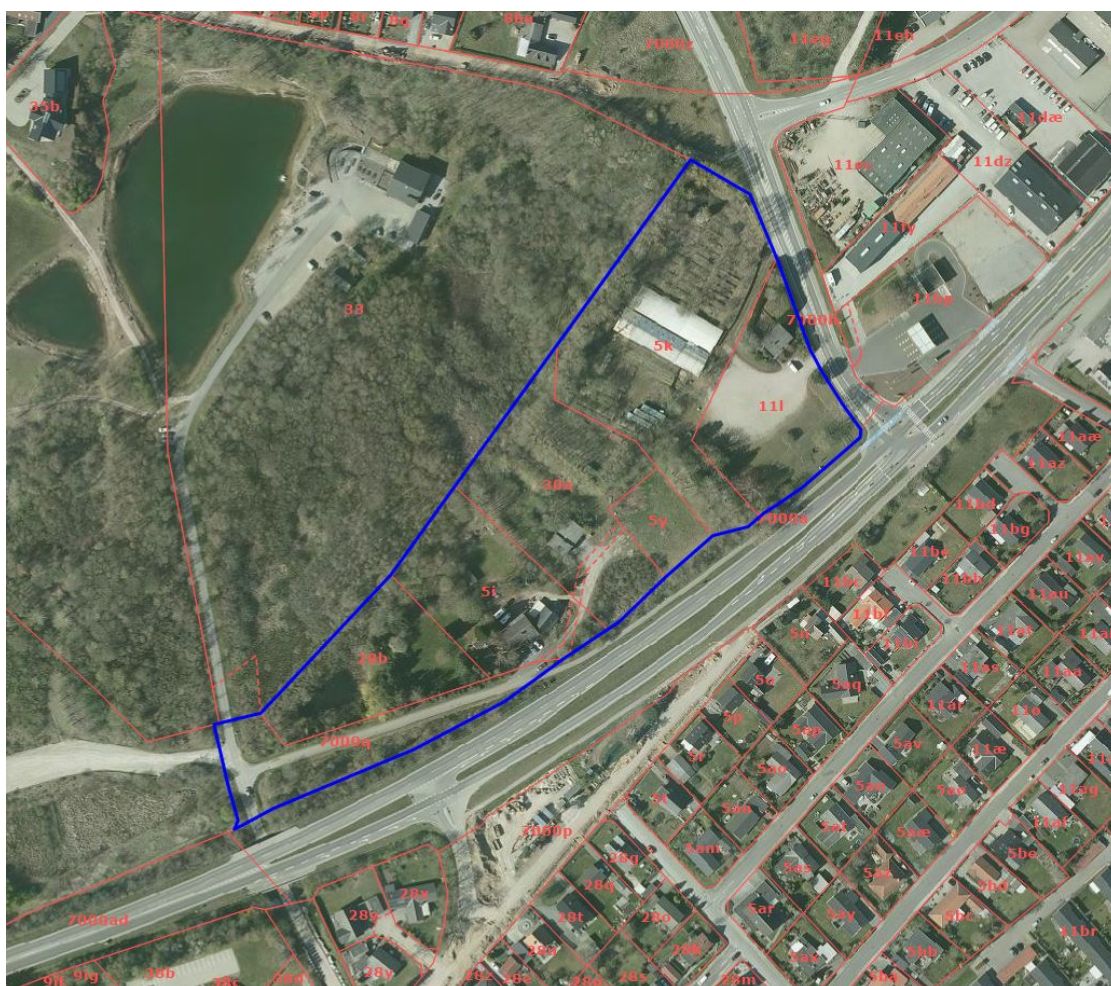
Afgræsning af kommuneplantillæg.

I forbindelse med kommuneplantillæg nr. 19 udarbejdes lokalplan 1144, for en del af området, som sikrer områdets anvendelse til tæt-lav og etagebebyggelse. Lokalplanen vil samtidig sikre adgangsvej fra Gesagervej, grønne fælles arealer, parkering og regnvandshåndtering.