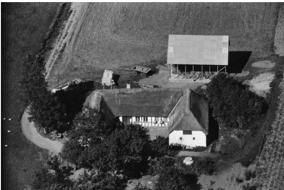
taget i perioden 1948-54

I BBR står ejendommen til at være opført i 1820. Mindst 2 af ejendommens længer er oprindeligt opført i bindingsværk og noget af ejendommen står stadig i BBR som værende bindingsværk. På fotoet nedenfor ses ejendommen i tidsrummet 1948-54, hvor hele ejendommen stod med stråtag, men selvom tagmaterialet i dag er et andet, kan man stadig se, hvor de oprindelige halvvalm har været da de er markeret af de røde gavlbeklædninger.