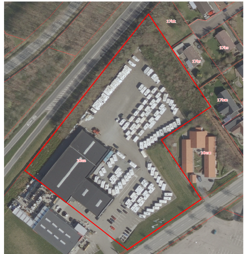
Afgrænsning af lokalplan 1106 og kommuneplantillæg nr. 19