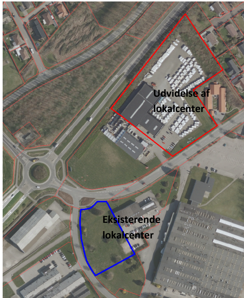
Eksisterende lokalcenter samt udvidelse af lokalcentret