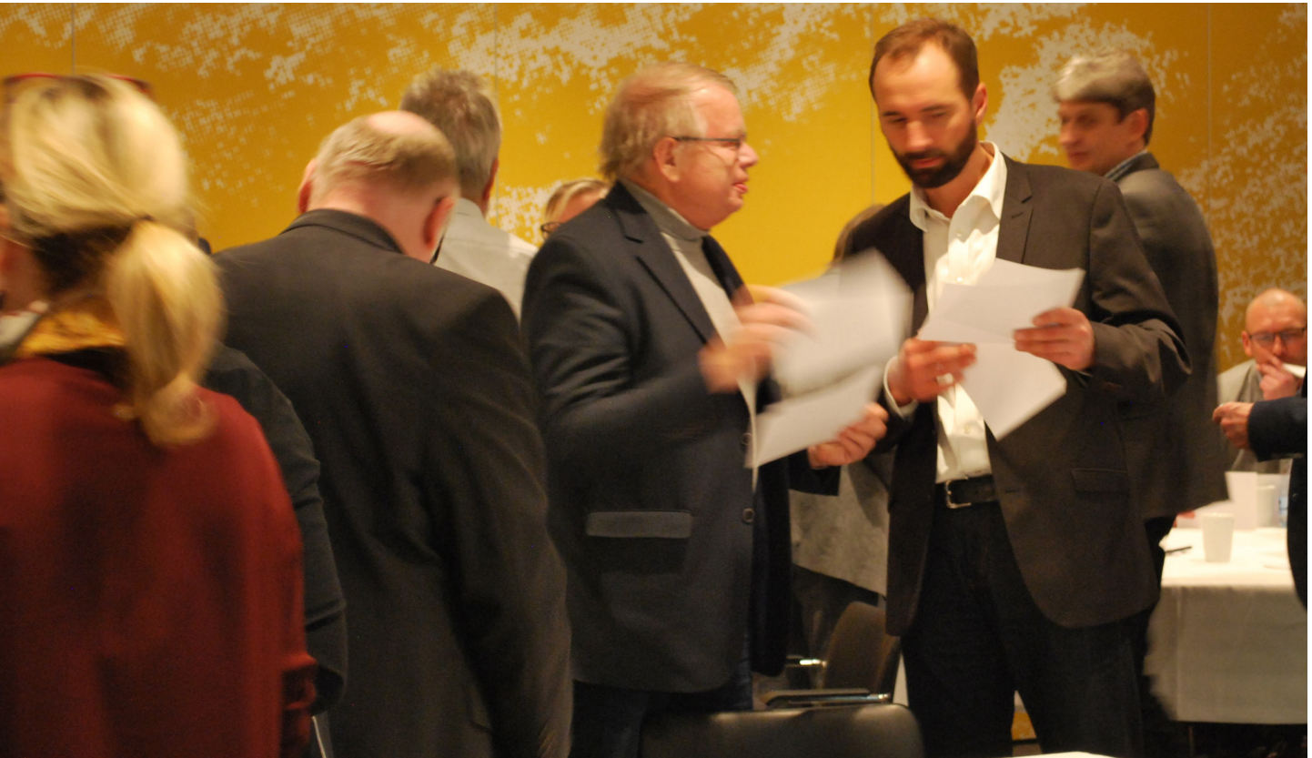
Udveksling af gode ideer til politiske arbejdsformer på konferencen i Rebild.