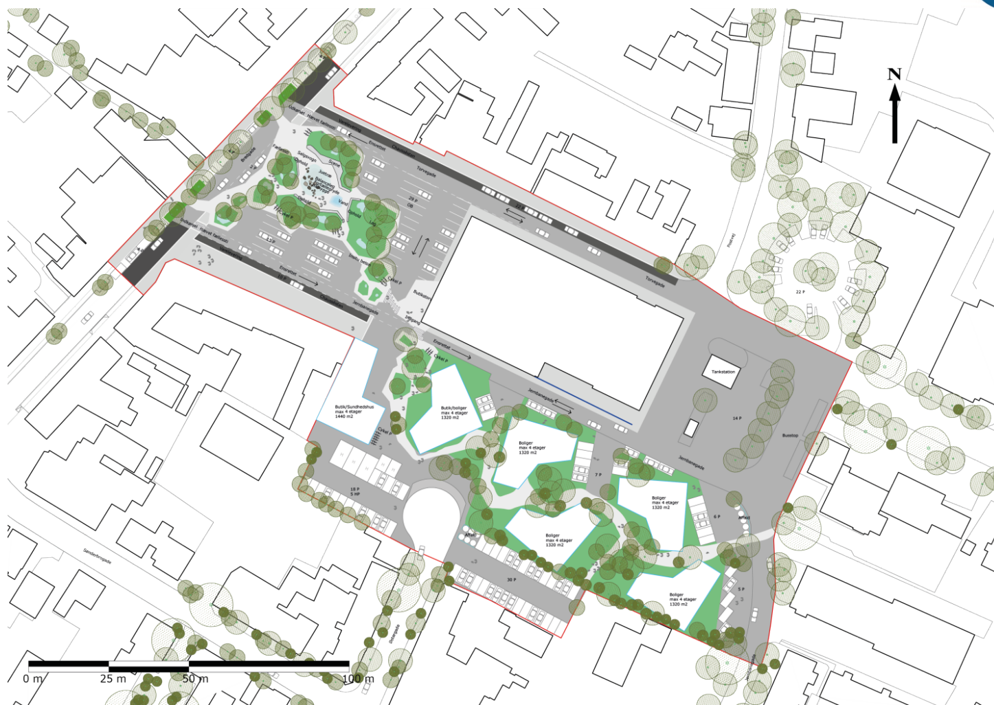
Situationsplan – illustration.