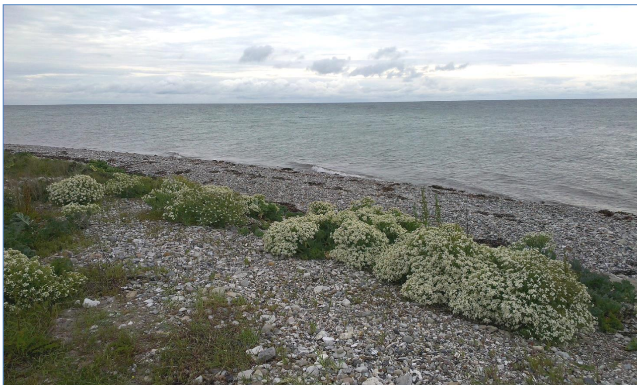
Strandvold med flerårig vegetation på Endelave