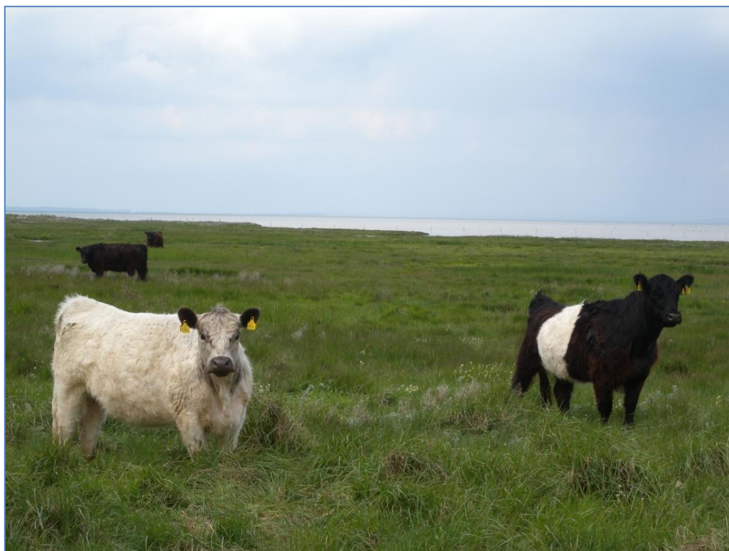
Naturplejere på strandengen