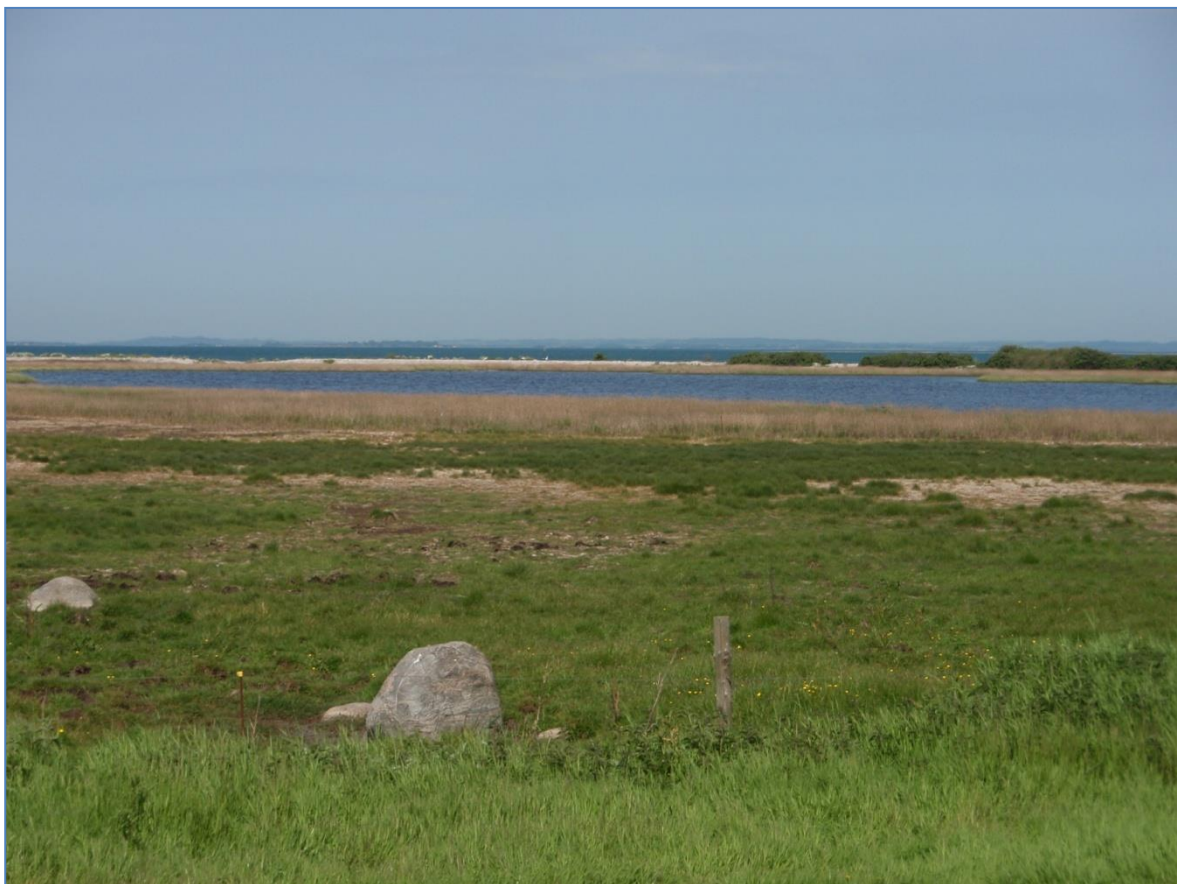
Havkig over habitatnaturtypen strandeng på Kloben.

**Hegninger (nye hegn samt drift af eksisterende) og rydninger af uønsket opvækst (ud over invasive arter).