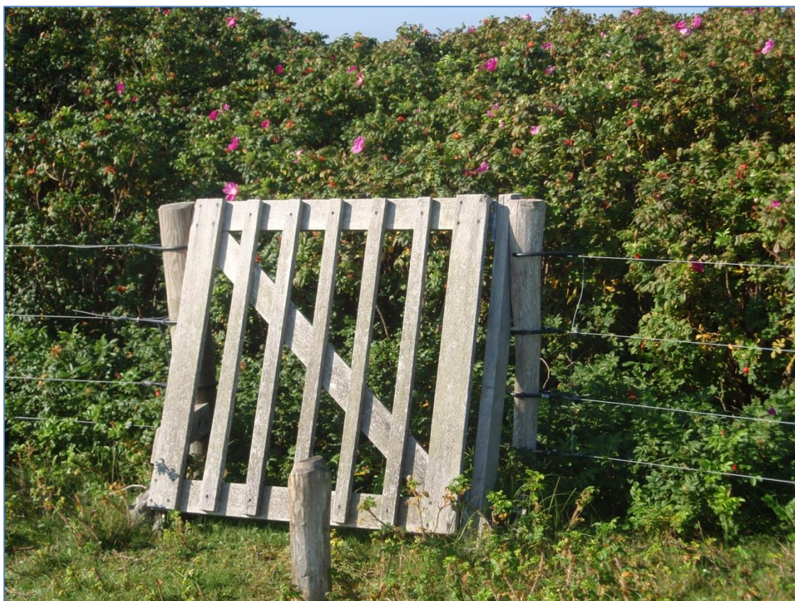
Den uønskede art Rosa rugosa , som betragtes som invasiv, Skal bekæmpes sammen med andre uønskede arter.

For samtlige statslige Natura 2000-planer er der foretaget en strategisk miljøvurdering. Den kommunale Natura 2000-handleplan er som udgangspunkt omfattet af krav om miljøvurdering i henhold til lov om miljøvurdering af planer og programmer (lovbekendtgørelse nr. 1533 af 10. december 2015). For samtlige statslige Natura 2000-planer er der foretaget en strategisk miljøvurdering. Handleplanen for Horsens Fjord, havet øst for og Endelave er screenet, og det er vurderet at planen ikke har en væsentlig indvirkning på miljøet, og derfor ikke er omfattet af lovens krav om en egentlig miljøvurdering. Afgørelsen har været offentliggjort på kommunens hjemmeside fra den 8. februar 2017.