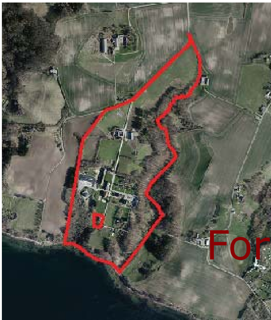
Luftfoto med afgrænsning af kommuneplantillægget