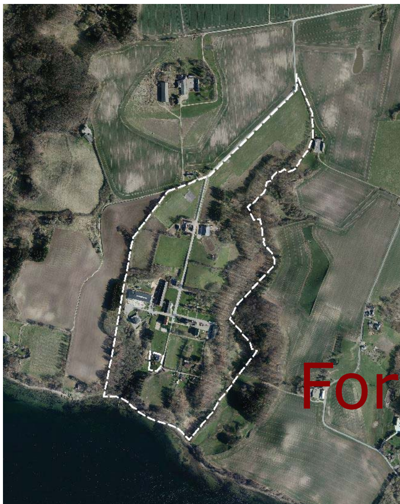
Luftfoto med afgrænsning af kommuneplantillægget