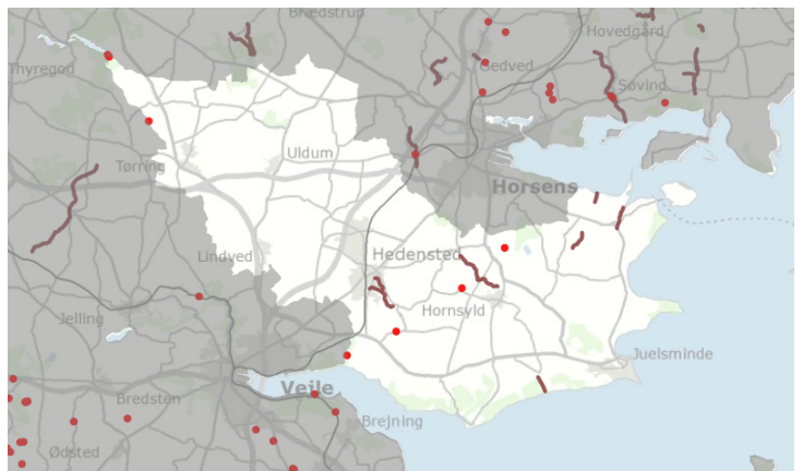
Kort 3 Opgave 3, Røde prikker er videreførte spærringer og brune streger er restaurerings projekter.

Vandrådet i Horsens Fjord har enstemmigt besvaret opgave 3. Vandrådet har vurderet og kommenteret på det tidligere vandråds anbefalinger, indsatsprogrammet og effektueringen på et overordnet og principielt niveau.