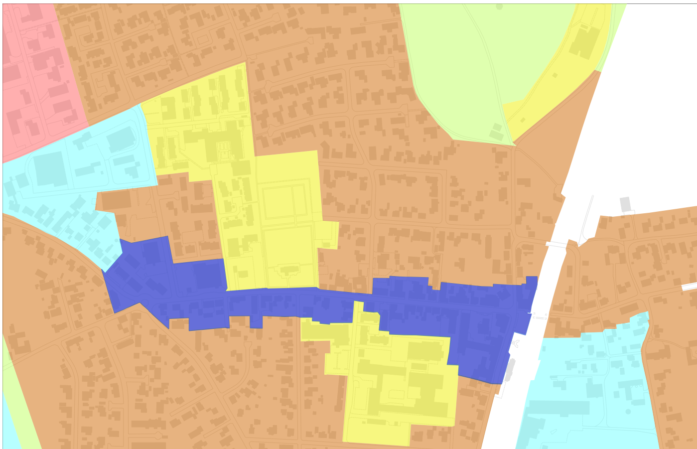
Kommuneplanramme 5.C.01 i kommuneplan 2013-2025