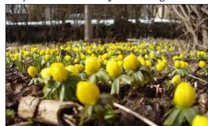
Inspirationsfoto bunddække i Skoven