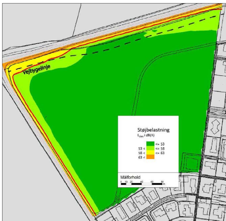
Resultaterne af støjberegningen

Horsens Museum har foretaget en arkivalisk kontrol af lokalplanens område. Museet vurderer: "Der findes ingen kendte, registrerede fortidsminder i området. Inden for nærområdet kendes der dog flere fortidsminder i form af enkeltfund, primært af genstande fra stenalderen. Desuden kan det på det første matrikelkort fra 1818 ses, at der her ligger en mindre gård på matriklen, hvis alder ikke kendes. På arealerne øst for området er der foretaget arkæologiske forundersøgelser forud for byggemodningerne her. Der er ved de lejligheder fundet få spor af fortidsminder, som ikke har givet anledning til egentlige undersøgelser efterfølgende. Sydøst for området har der tidligere ligget flere gravhøje. Områdets landskabsmæssige beliggenhed er dog velegnet til både bebyggelse og grave i forhistorisk tid og det vurderes, at der foruden den lille gård fra historisk tid kan findes andre skjulte fortidsminder i området. Horsens Museum må derfor anbefale, at der foretages arkæologiske forundersøgelser før eventuelle anlægsarbejder."