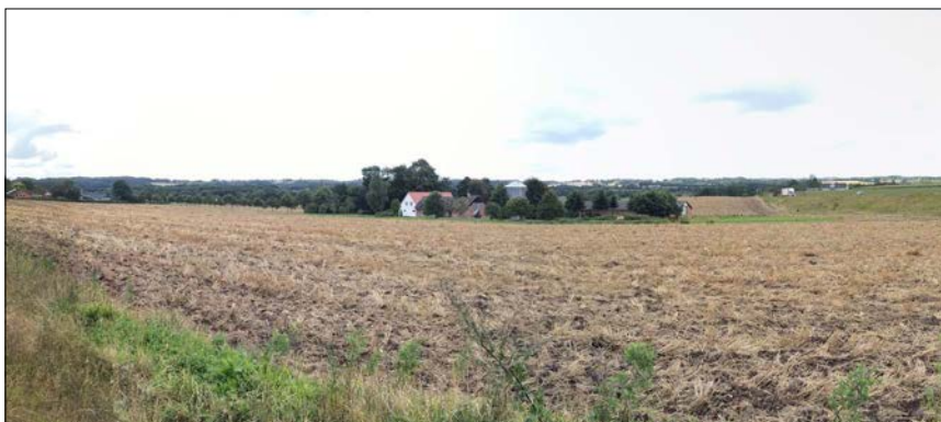
Lokalplanområdet set fra sti ved Sikavej.

Midt igennem lokalplanområdet etableres et grønt rekreativt bælte med sø, skov og eng. Det grønne bælte forbindes af lokalplanområdets stisystem.