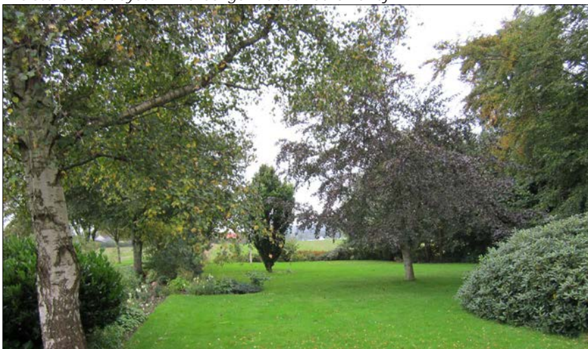
Eksisterende haveanlæg ved Follerupgård.