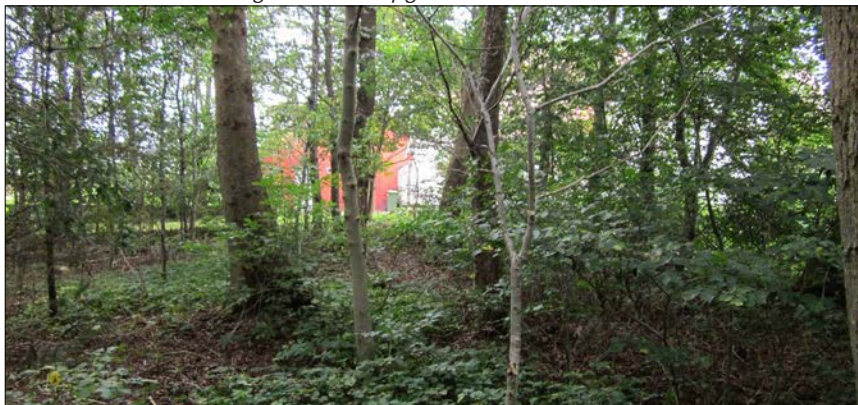
Eksisterende skovbeplantning ved Follerupgård.