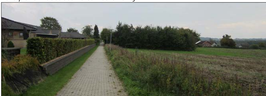
Eksisterende stisystem fra boligområdet ved Sikavej.