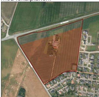
Kommuneplan ramme 7.B.16

Lokalplanen er ikke i overensstemmelse med kommuneplanramme nr. 7.B.16 idet området udlægges til blandet boligområde. Der er udarbejdet et kommuneplantillæg i forbindelse med lokalplanen.