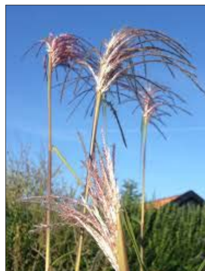
Inspirationsfoto højt Elefantgræs

Mod Elsdyrvej friholdes en forbindelse, som gør at det nye boligområde ikke vil påvirke området ved Elsdyrvej.