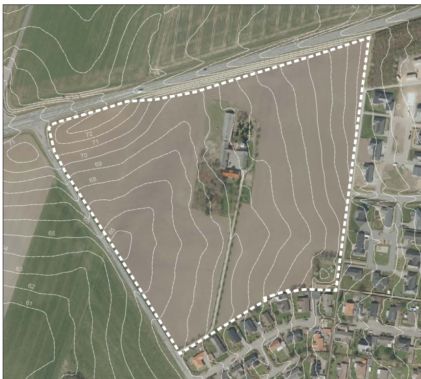
Luffoto, med indtegnede koter, der viser arealets store terrænforskelle.