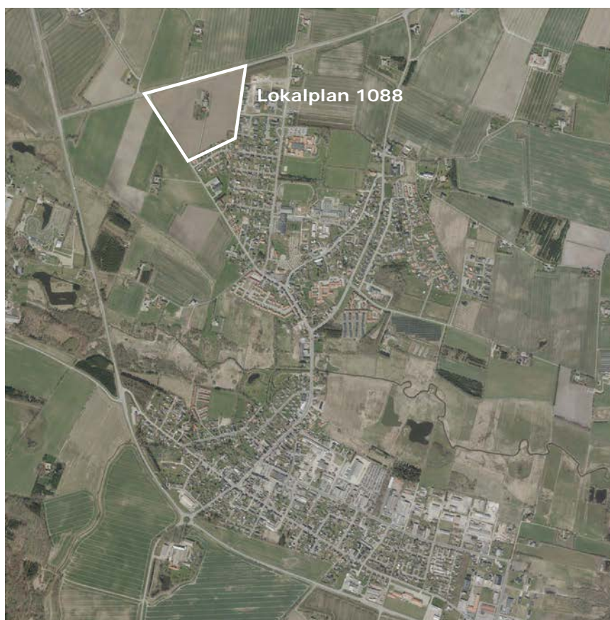
Lokalplanområdets placering i Tørring by.

Terrænet indenfor lokalplanområdet falder cirka 13 meter mod Viborgvej, der løber vest for lokalplanområdet.