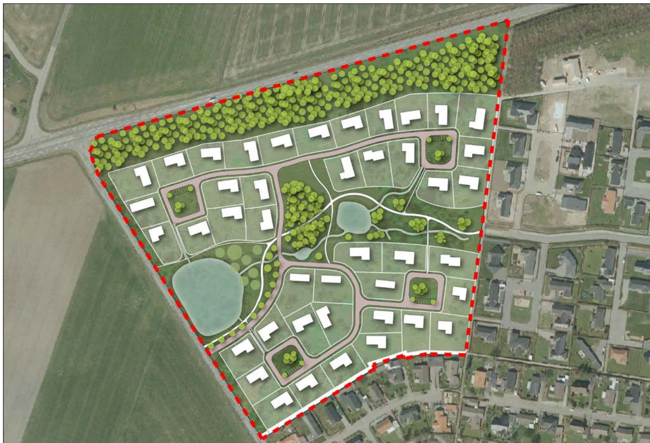
Alternativ 1: Åben-lav bebyggelse