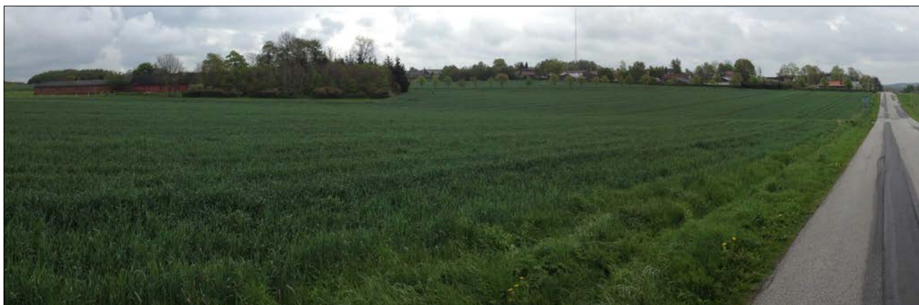
Lokalplanområdet set fra Viborgvej

Affald skal håndteres i henhold til gældende bekendtgørelse om affald samt Hedensted Kommunes regulativ for husholdningsaffald.