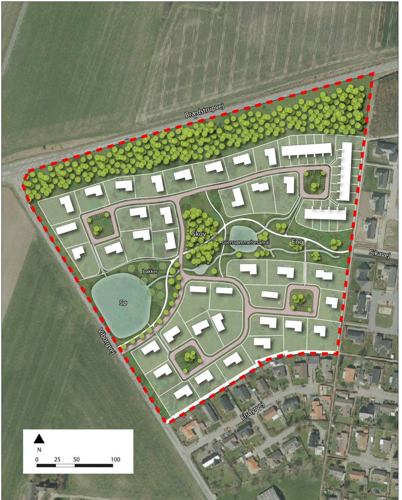
Kortbilag nr. 3b - Illustrationsplan åben-lav + tæt-lav