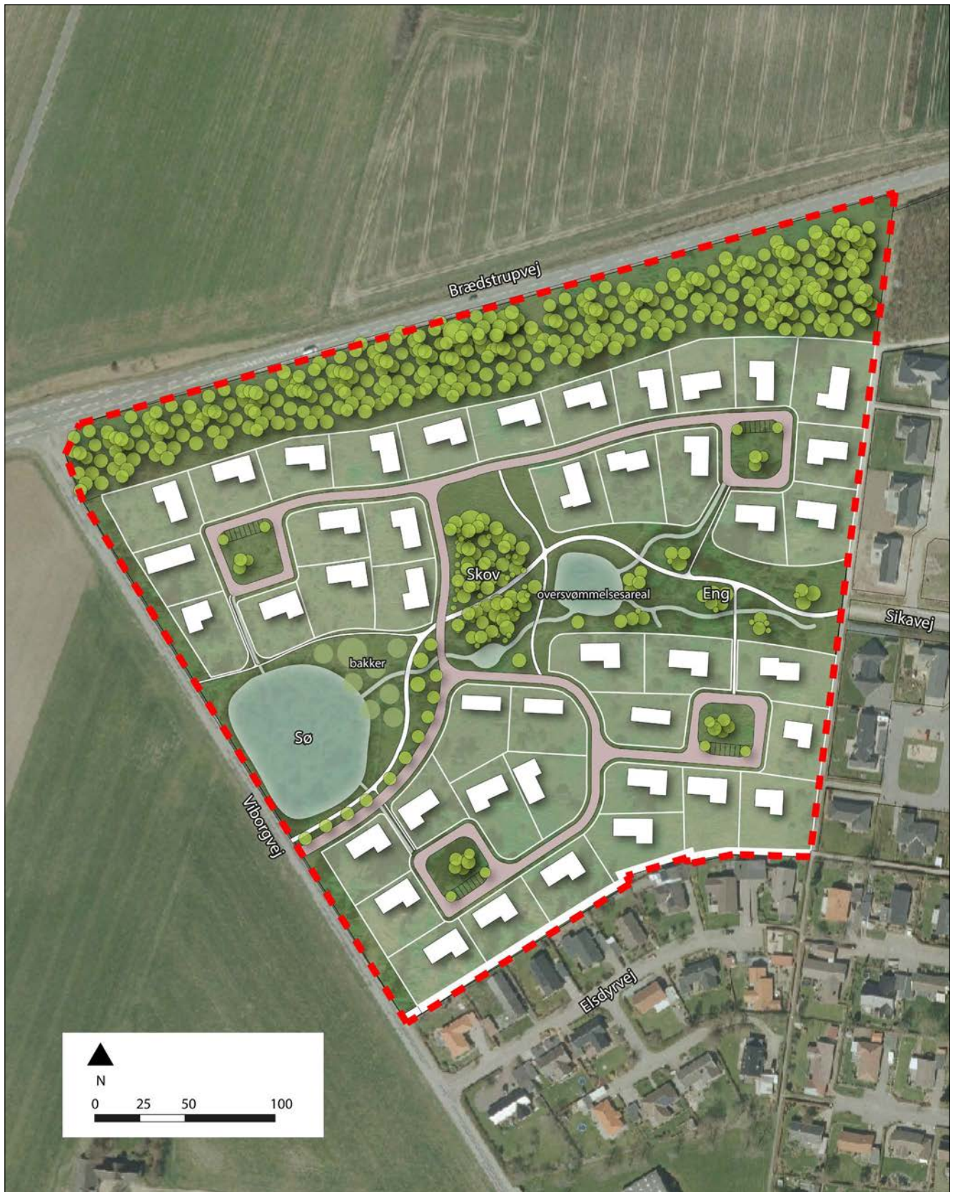
Kortbilag nr. 3a - Illustrationsplan åben-lav