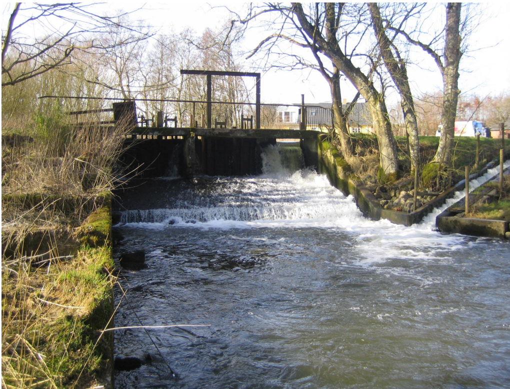
Opstemningen ved Klaks Mølle blev i 2012 fjernet, og erstattet af et hurtigt løbende åløb.