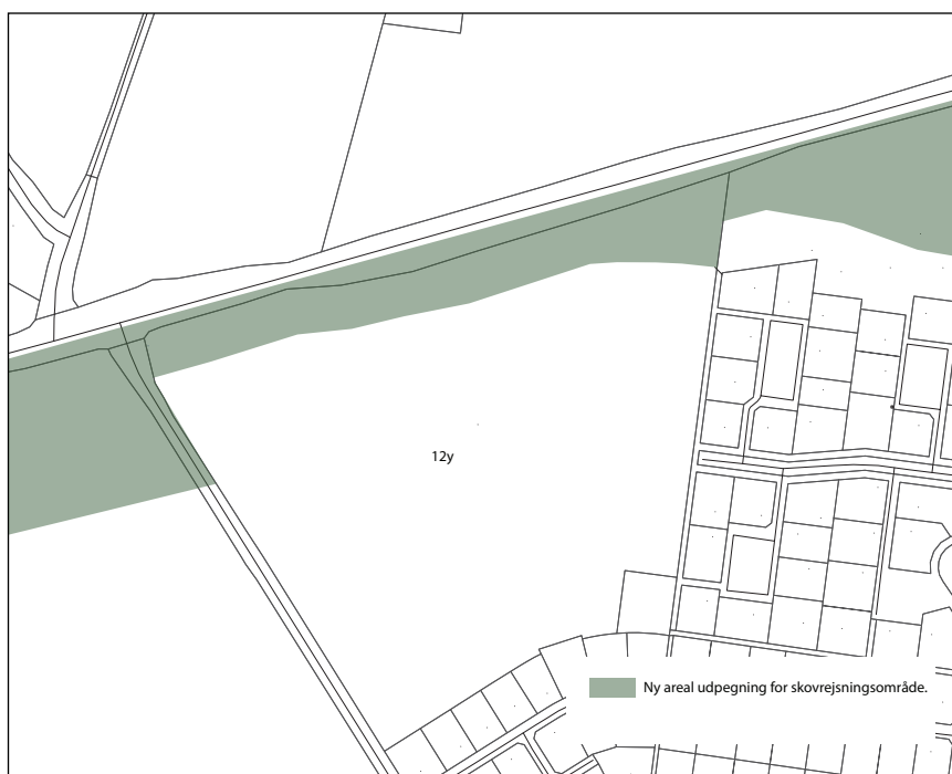
Fremtidig afgrænsning skovrejsningsområde.