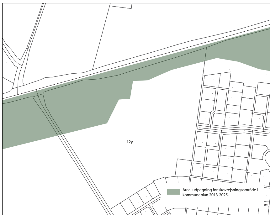
Nuværende afgrænsning skovrejsningsområde

Arealet indenfor lokalplanområdet, der herefter udpeges til skovrejsningsområde, vil blive beplantet i forbindelse med realiseringen af lokalplan 1088.