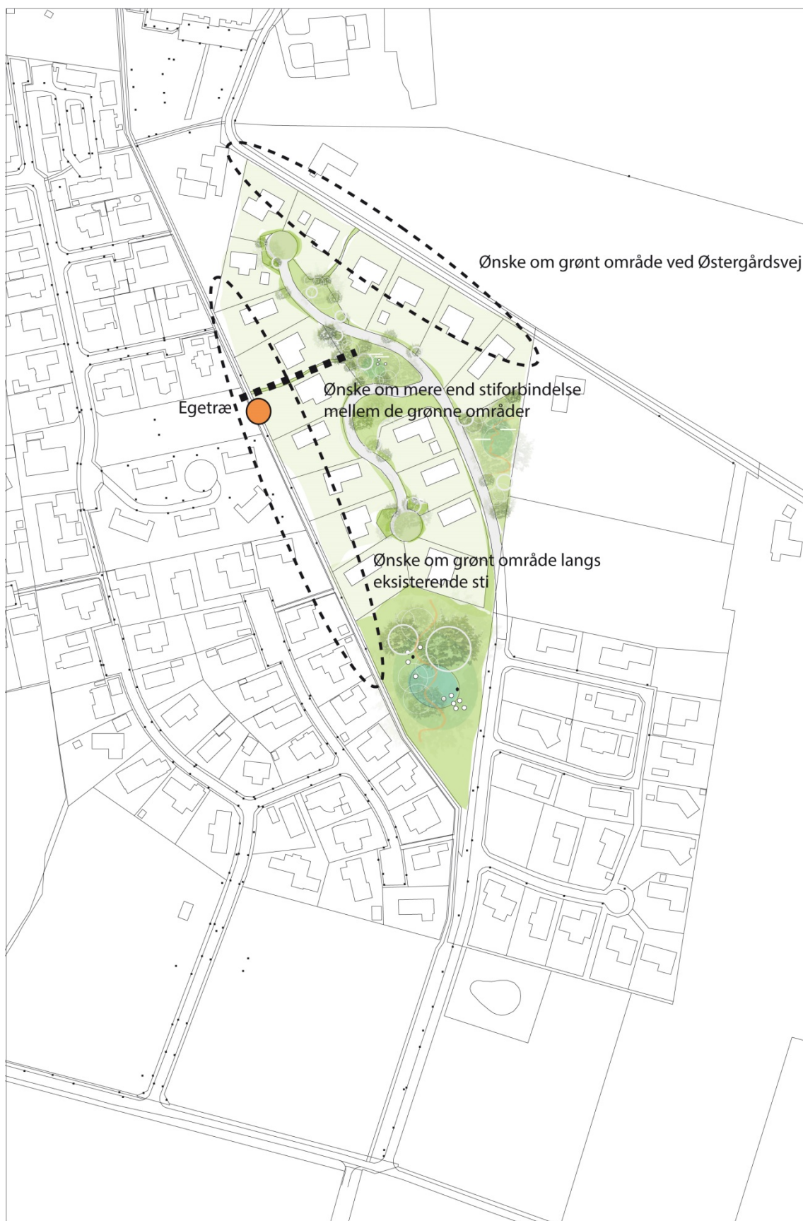
Illustration med anviste bemærkninger fra Grundejerforeningen Overbygård