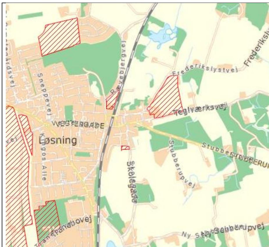
Retningslinje 1.1 - Byudvikling og byzone