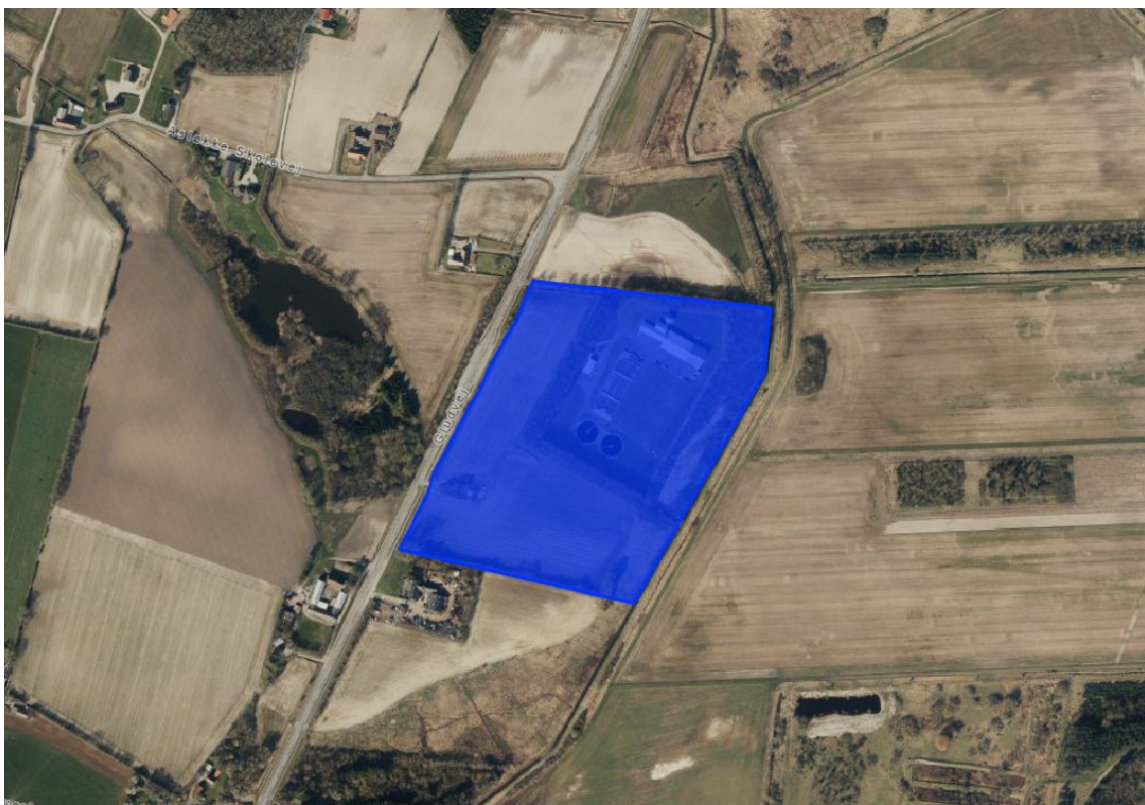
Luffoto med ramme 1.T.01 - Juelsminde Renseanlæg. Der ændres ikke på afgrænsning og rammenr.