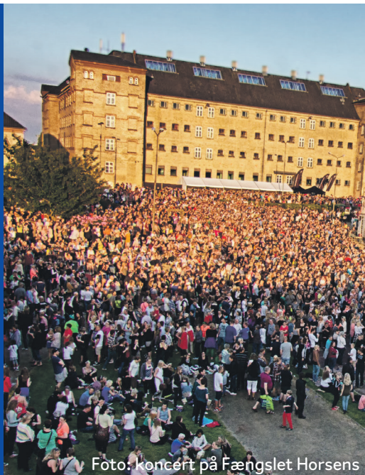
koncert på Fængslet Horsens

Aarhus 2017 er bygget op omkring mere end 160 projekter, en lang række tværgående samarbejder og enkeltstående events af forskellig volumen. Det er stort, mangfoldigt og varierer i tid, udstrækning, størrelse og fokus. Nogle projekter er startet for længst, andre bygges op lige nu og nogen folder sig først for alvor ud, når vi rammer datoen for åbningsevenen 21. januar 2017. Fra 14. til 18. april i Ridehuset i Aarhus kan du se, hvordan projekterne arbejder, hvad de arbejder med og hvor langt de er. Du kan også møde en lang række gæster fra ind- og udland. (følg kalenderen på www.aarhus2017.dk ).