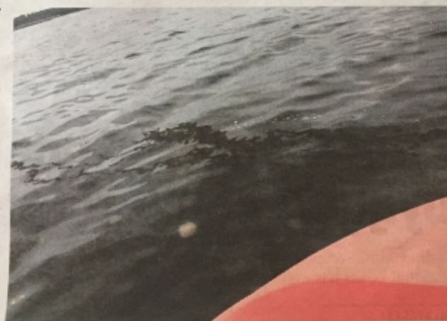
Kigger man godt efter, kan man se, at der er tale om aske og ikke olie.