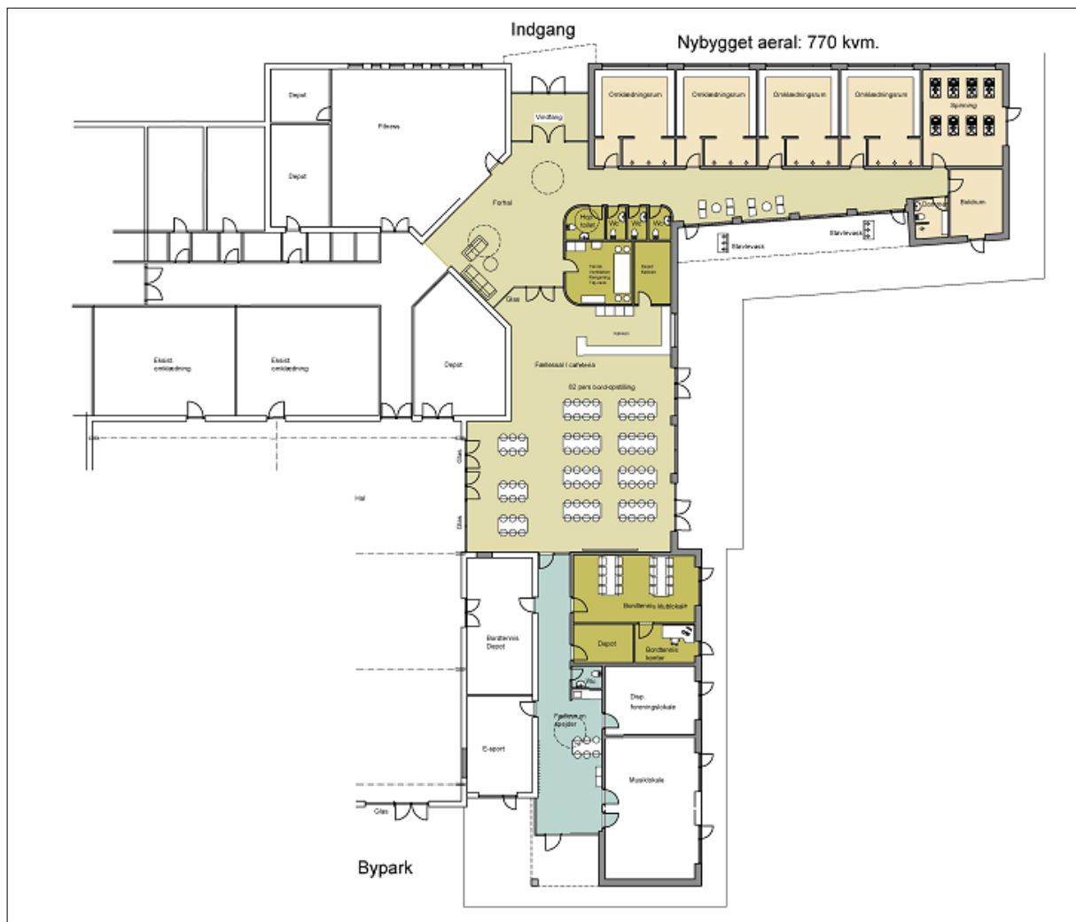
Oprindeligt skitseforslag - dec. 2020

Administrationens vurdering er dog, at anlægget koster 15,4 mio. kr. ekskl. moms idet en m 2 -pris vurderes at være 20.000 kr. pr. m 2 . Derudover er det usikkert om bygningen kan etableres uden moms og derved vurderes bygningen samlet set at kunne koste knap 19,3 mio. kr.