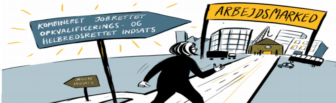
FIGUR 6. BETYDNINGEN AF AT DELTAGE I EN KOMBINERET INDSATS

Opkvalificeringsindsatser, sociale og helbredsrettede indsatser skaber i sig selv ikke progression mod arbejdsmarkedet. Det gør de faktisk kun, når de kombineres med andre indsatser, og altså særligt når de kombineres med en jobrettet indsats.