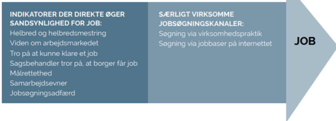
FIGUR 6. VEJEN TIL JOB

I afdækningen af beskæftigelsesindsatser blev det i samme Beskæftigelsesindikator projekt også klarlagt, at mangel på indsats er lig tilbagegang, samt at jobrettet indsats kombineret med helbredsrettet indsats giver de bedste muligheder for borgerens progression mod arbejde.