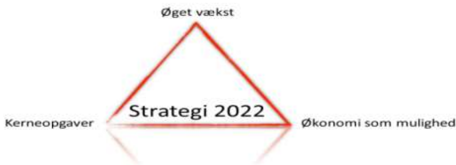
Figur 1 Pejlemærker for Strategi 2022

I det følgende notat beskrives det strategiske grundlag for indsatsen i Beskæftigelse fra 2020 og frem.